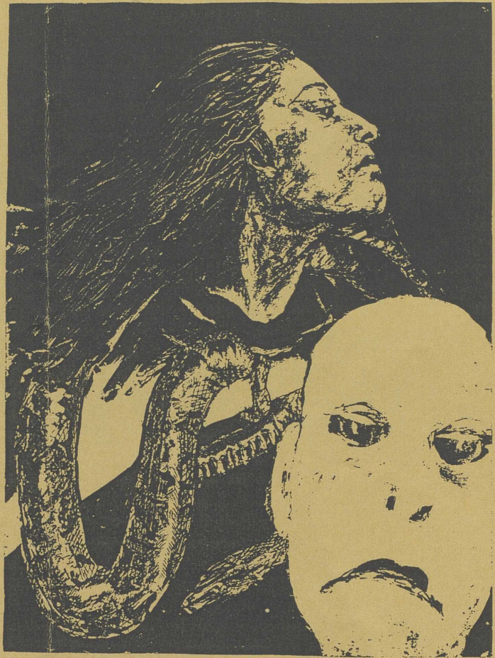
Illustration par Camelia Gugulea

Si vous souhaitez vous procurer l'une de ces illustrations, merci de vouloir contacter Anneke Walters au 42 62 77 99.