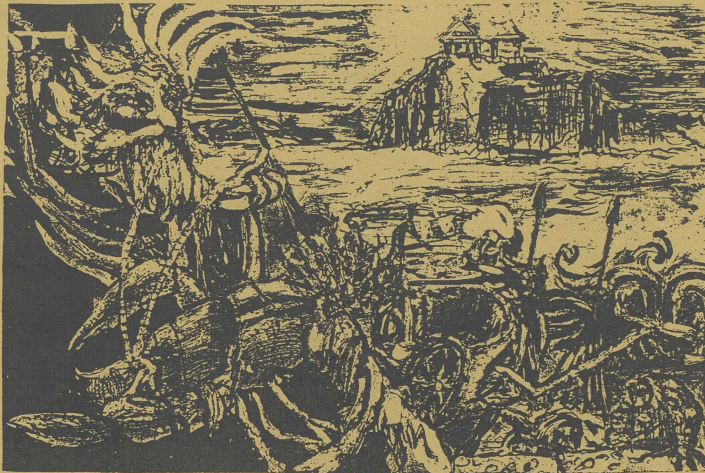
Illustration par Camelia Gugulea