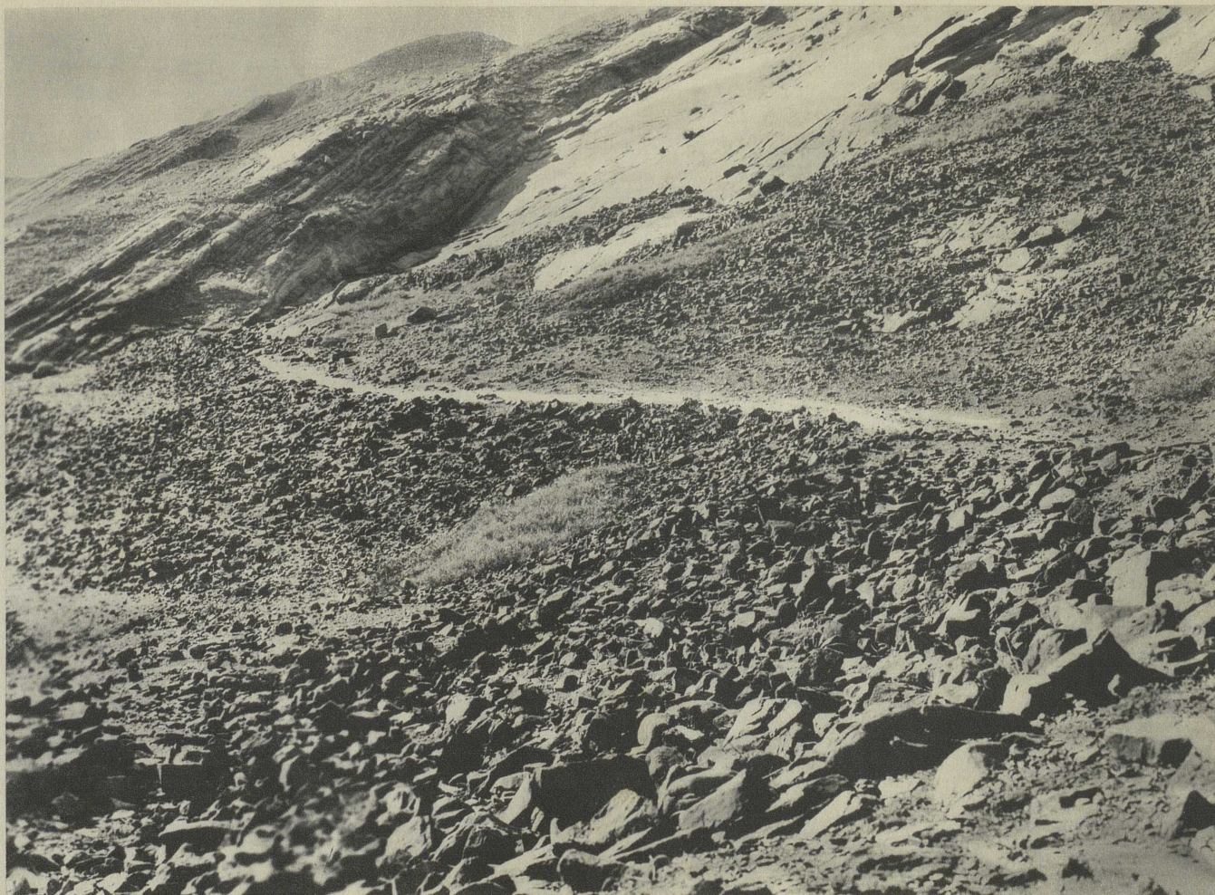
L'AVALANCHE DES RUINES DE LA VILLE AU-DELA DE LA MOSQUÉE AU SUD-OUEST