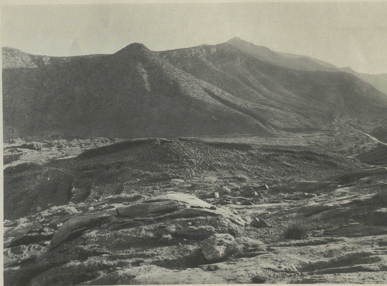
L'ENCEINTE DE LA KECHLA (LE MUR CIRCULAIRE) SUR L'ACROPOLE