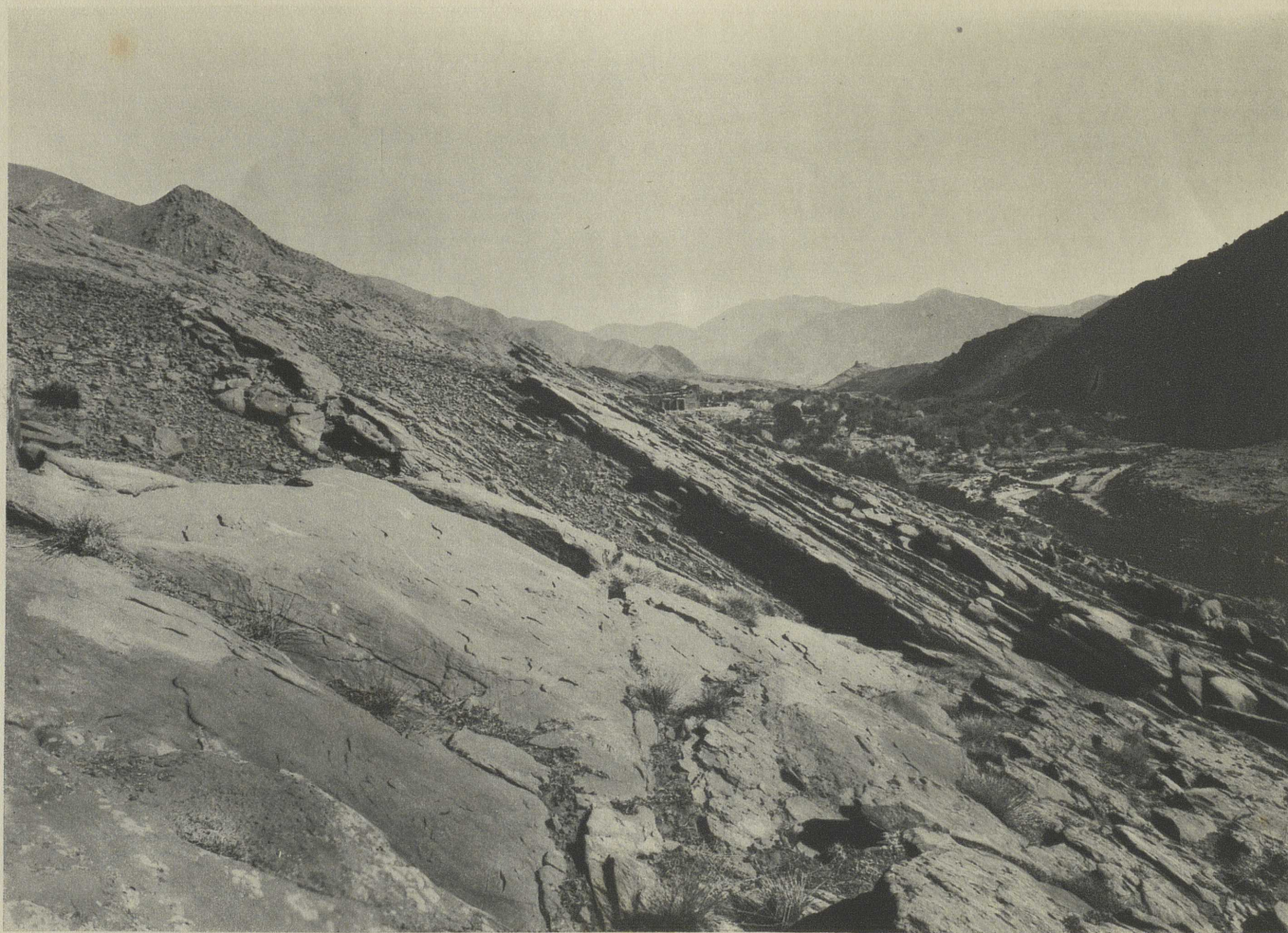
VUE DE TINMEL PRISE DE TALAT NOUGUEDI AU SUD-OUEST ON APERÇOIT LA MOSQUÉE AU MILIEU