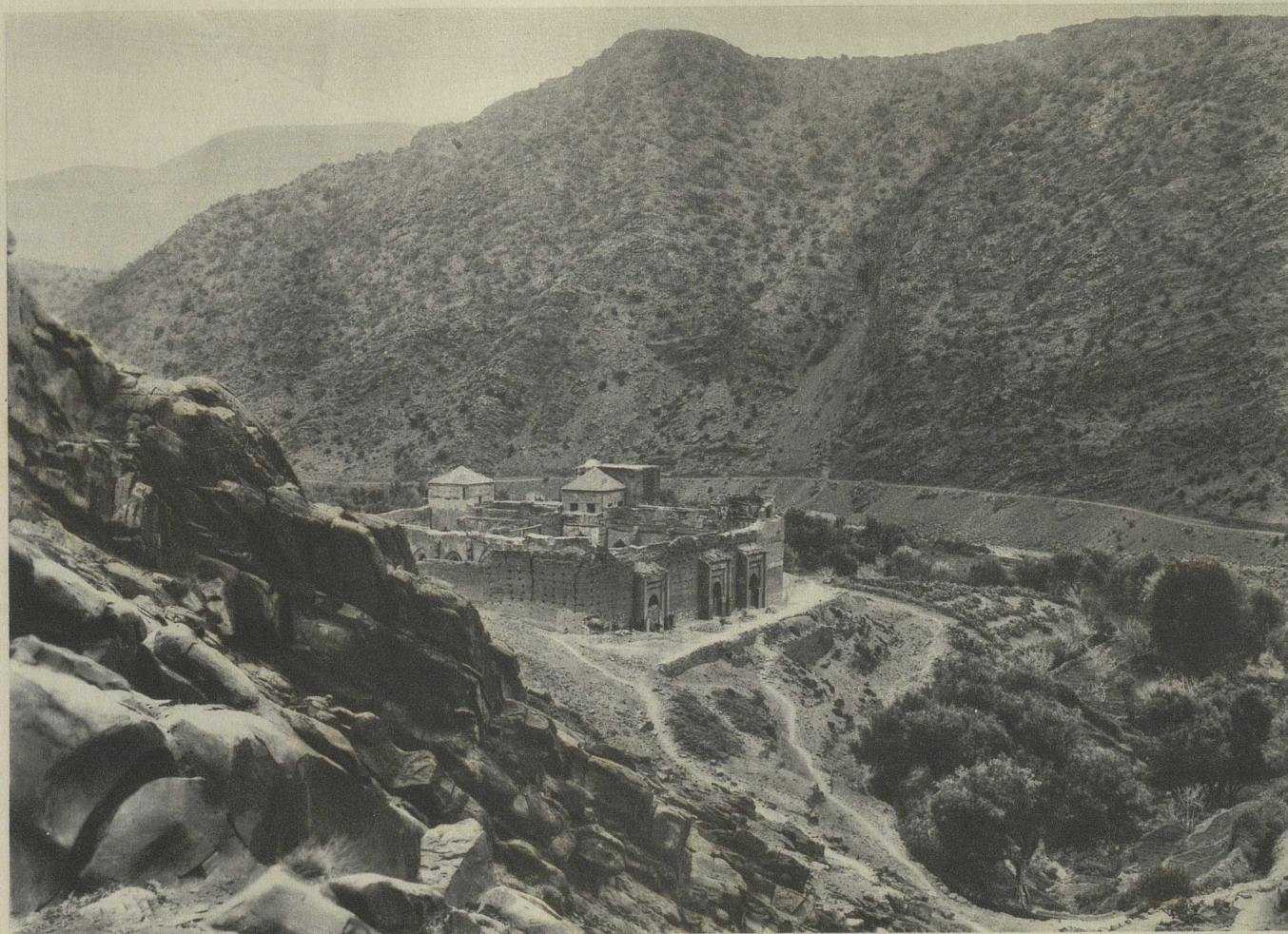
LA MOSQUÉE VUE DE L'ACROPOLE