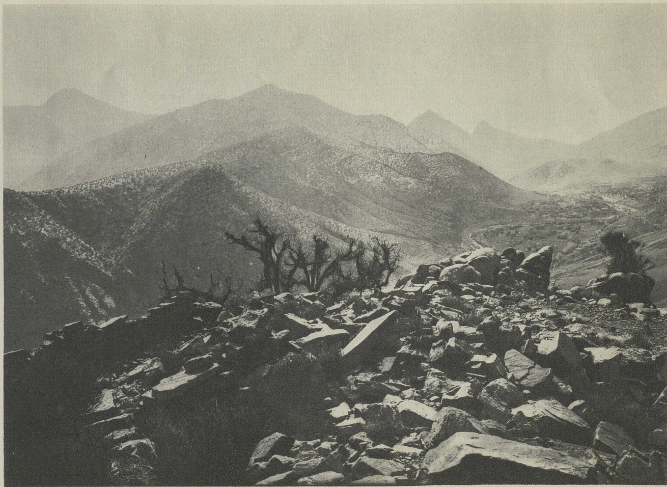
RUINES DE LA FORTERESSE DE TAOURIRT N'TIDAF