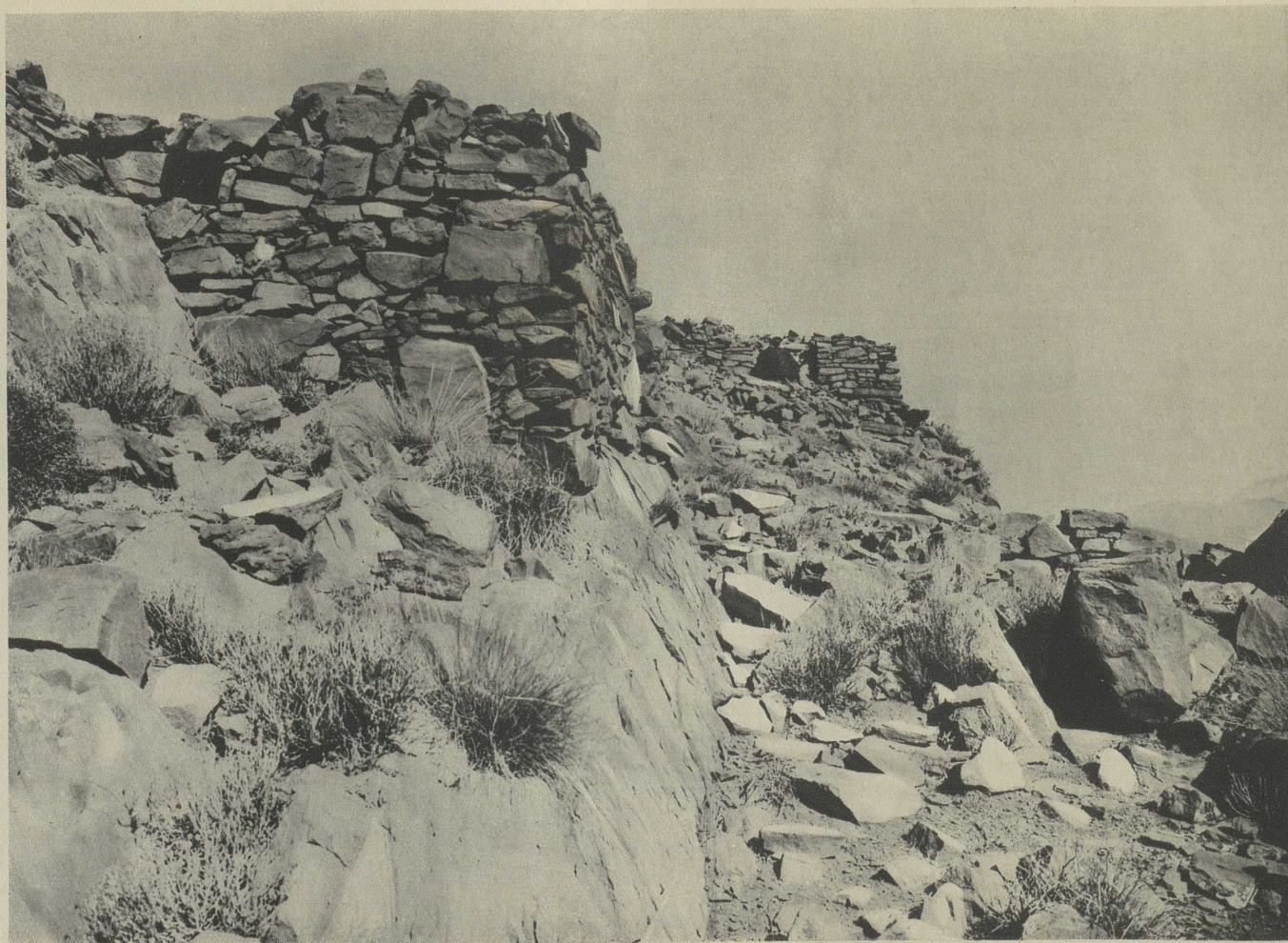
AU SOMMET DE LA FORTERESSE DE TAOURIRT N'TIDAF