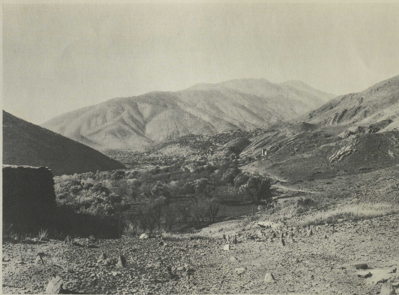
VUE DE TINMEL PRISE DU HAUT DE LA VILLE AU SUD-EST DE TALAT MOUMELLIT ON APERÇOIT LA MOSQUÉE AU MILIEU