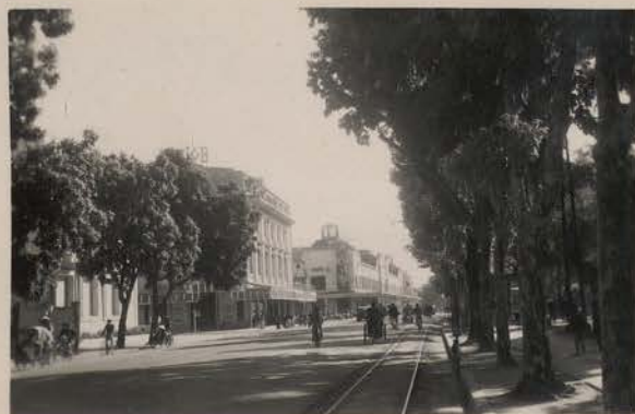
HANOI, 1953.- Boulevard Francis Garnier.