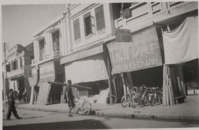
HANOI, juillet 1953.- Rue des stores.