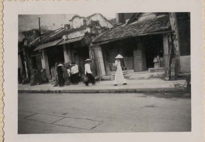
HANOI, août 1951.- Rue des Briques.