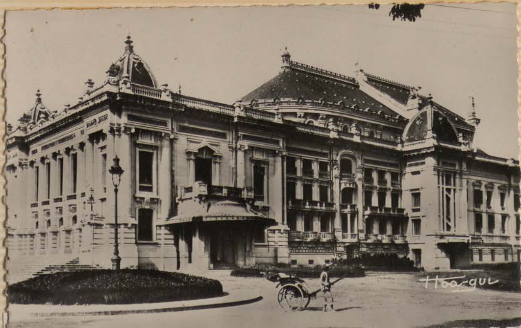
HANOI.- Le théâtre municipal (Carte postale Boy-Landry).