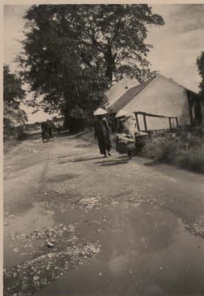
HANOI, juin 1952.- Sue la digue bordant la Grand Lac.