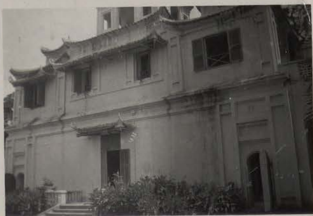
HANOI, juillet 1951.- La Citadelle : Bâtiment Nord de l'enceinte royale.