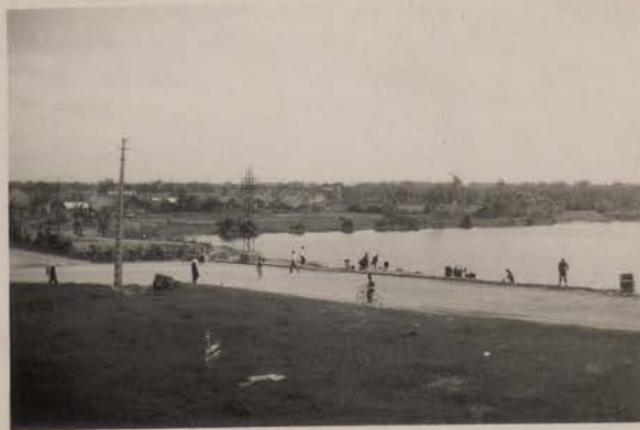
HANOI, février 1951.- Vue prise du haut du grand portique du Van Mieu.