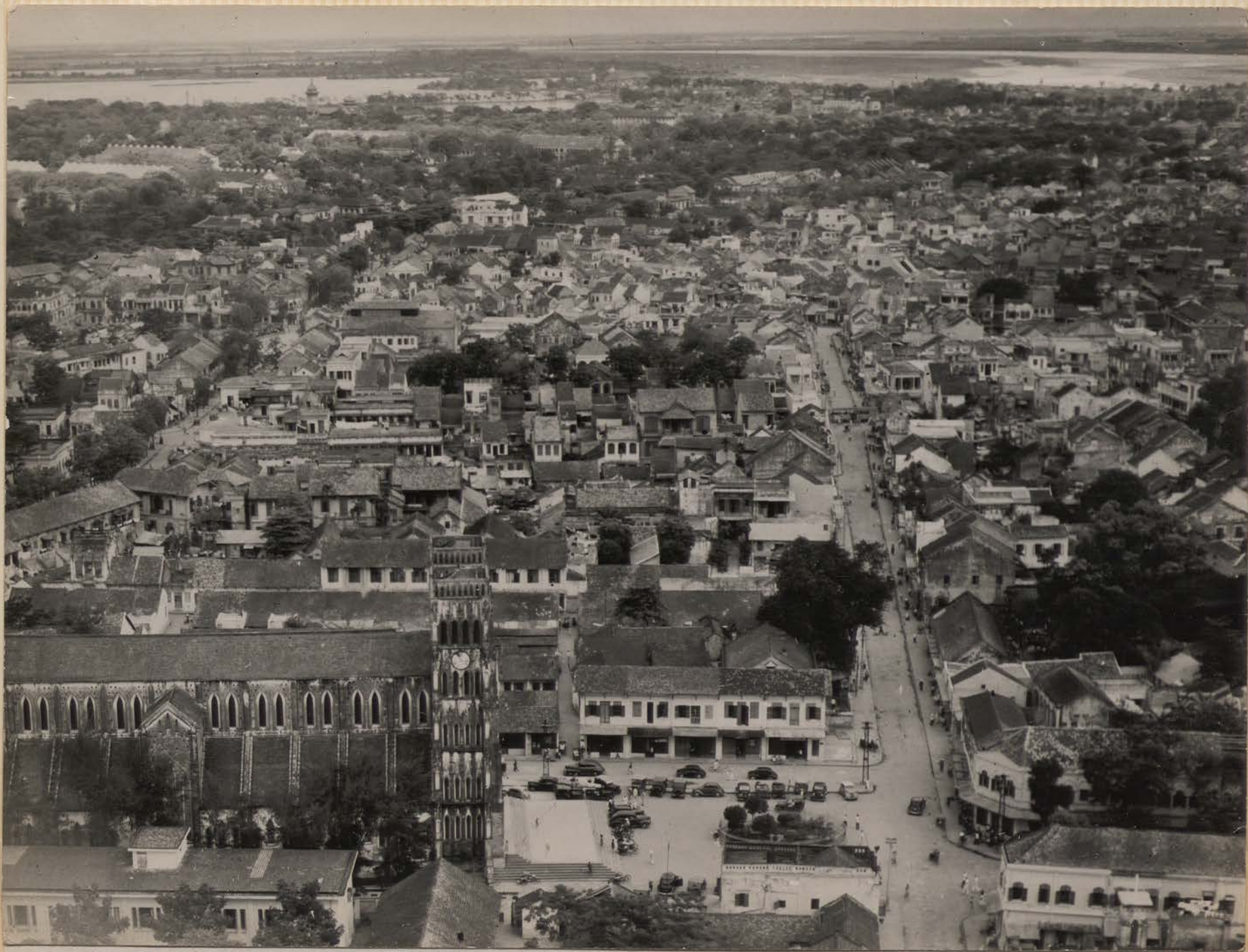
HANOI, mai 1951.- La cathédrale, vue vers le Nord.