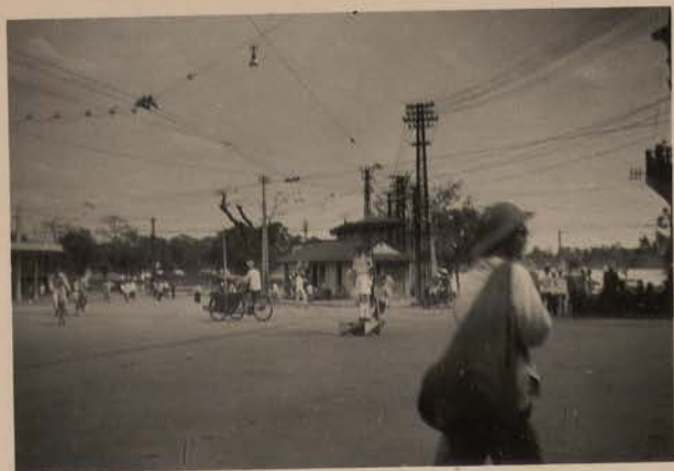
HANOI, avril 1952.- La place au nord du Petit Lac.