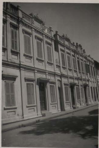
HANOI, juillet 1953.- Pho Bui Vien (quartier 4).