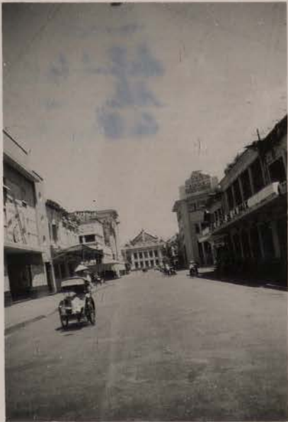
HANOI, 1951.- Rue Paul Bert.- au fond, le théâtre. A droite, à mi-distance, la Banque Franco- Chinoise.