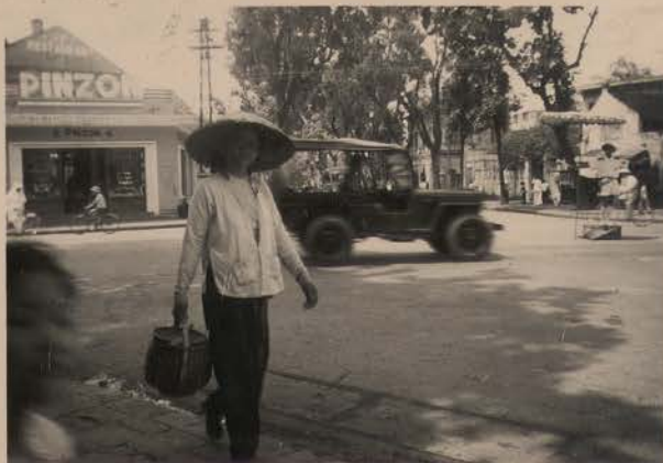
HANOI, mai 1952.- Place Neyret.