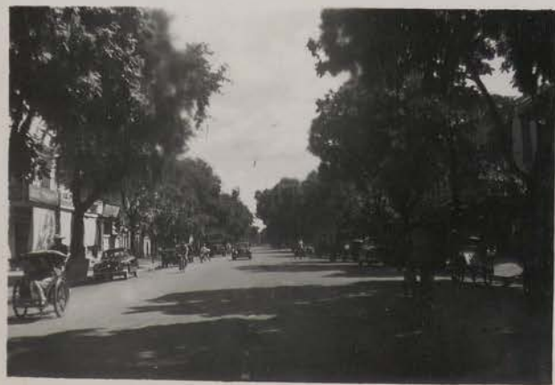
HANOI, 30 août 1954.- Bd. Gia Long.