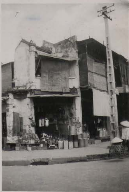
HANOI, août 1951.-L'angle de la rue des Ferblantiers et de la rue des Chapeaux.