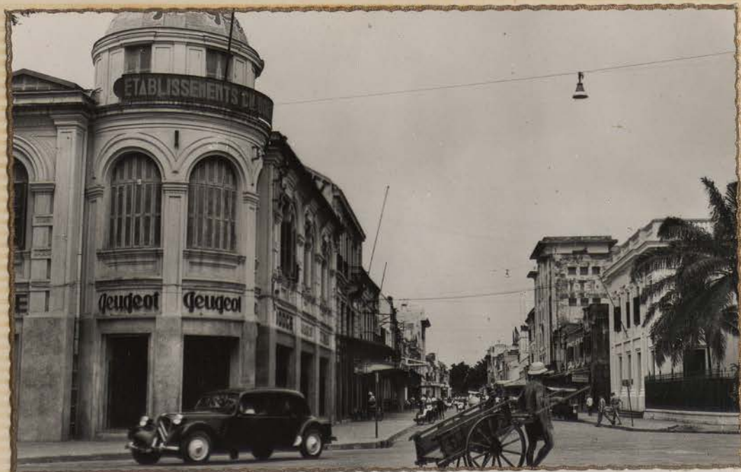
HANOI.- La rue Paul Bert (Carte Postale, Indochine-Photo-Studio)