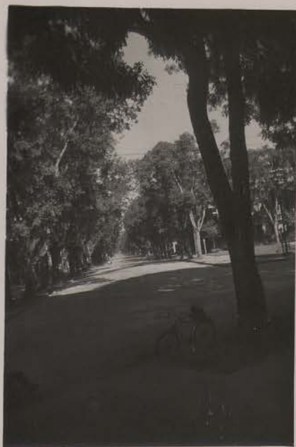
HANOI, août 1951. Perspective sur le Bd Carreau (1.700 m) prise des marches de l'Université.