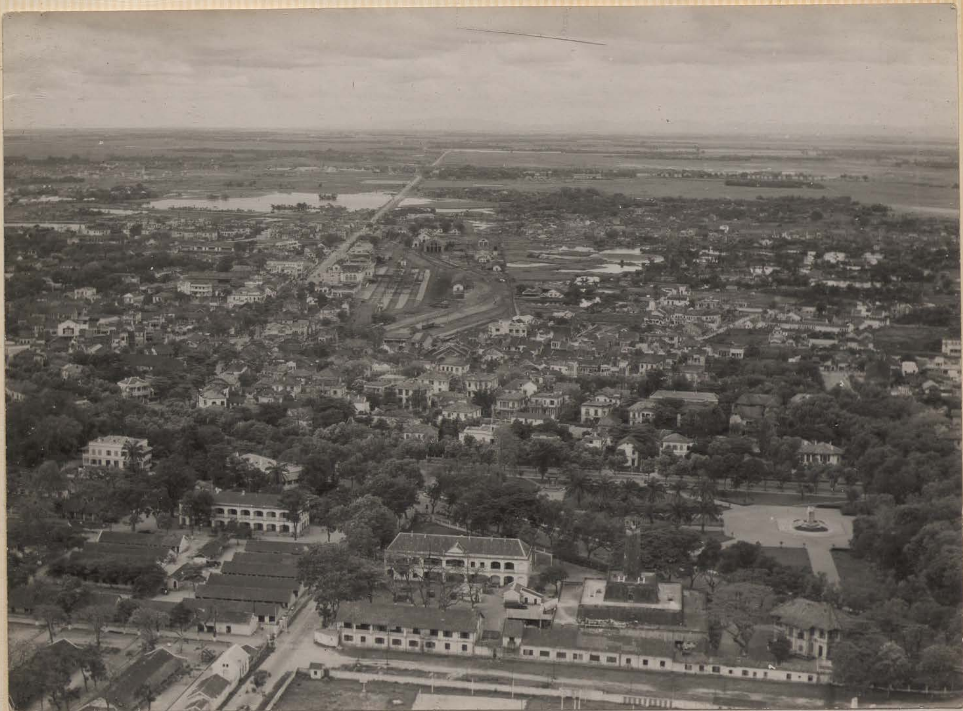
HANOI, mai 1951.- Vue prise au-dessus de la citadelle. Au premier plan, le Côt co' (Mirador) et le monument aux morts (à droite). Au 2 e plan, la Gare du Chemin de Fer, puis le lac Bay Mau.