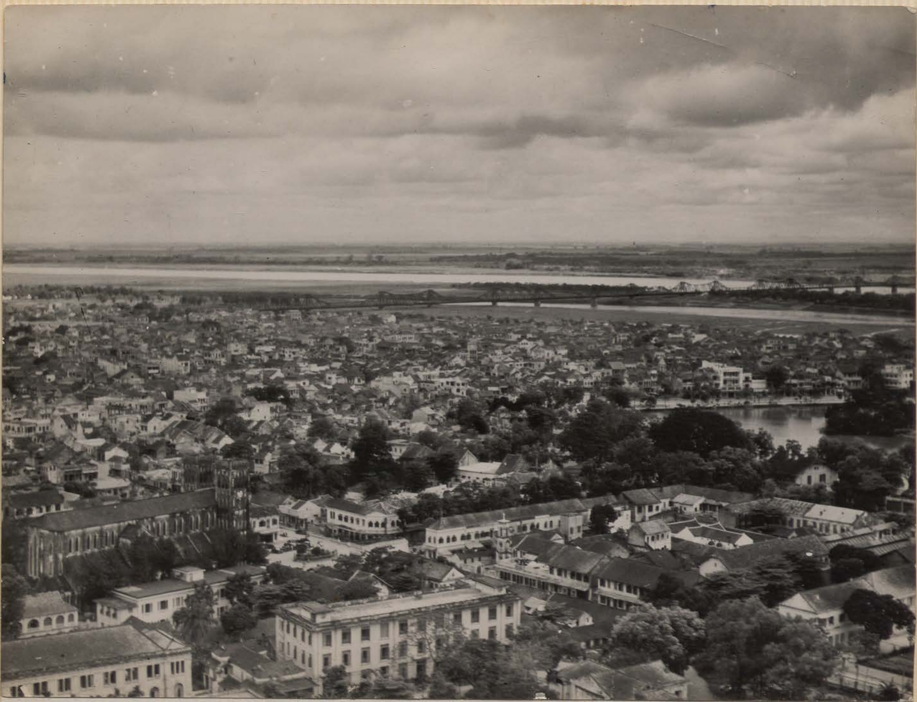
HANOI, mai 1951.- Le Fleuve Rouge et le pont Doumer.- Le Petit Lac et la Cathédrale.