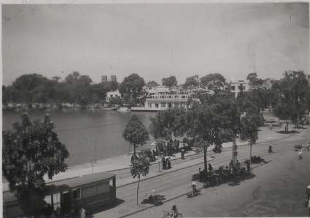
HANOI, 10 juillet 1954.- Le Petit Lac.