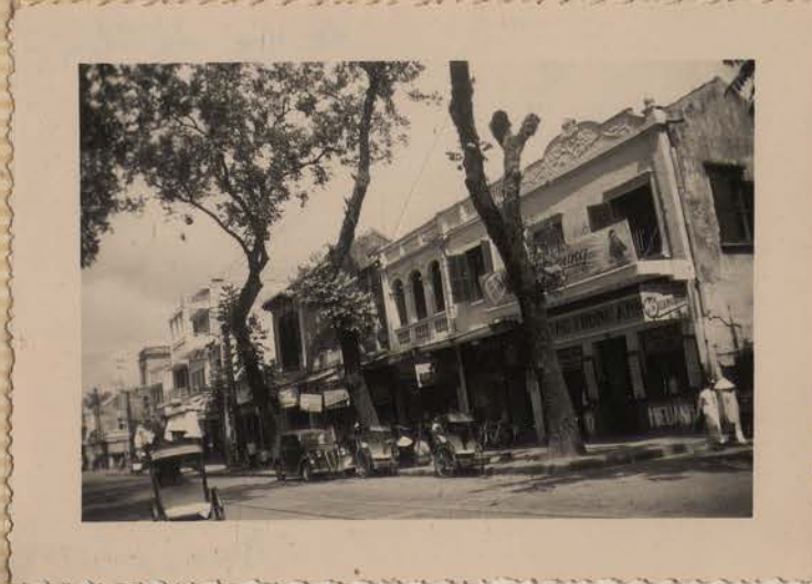
HANOI, juin 1952.- La rue du Coton.