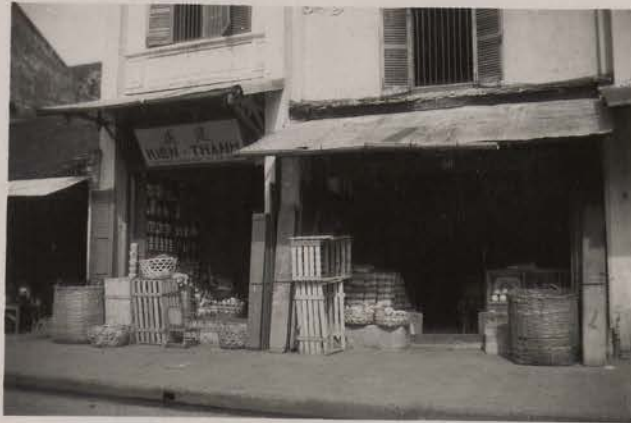
HANOI, juillet 1951.- Rue des Tasses.