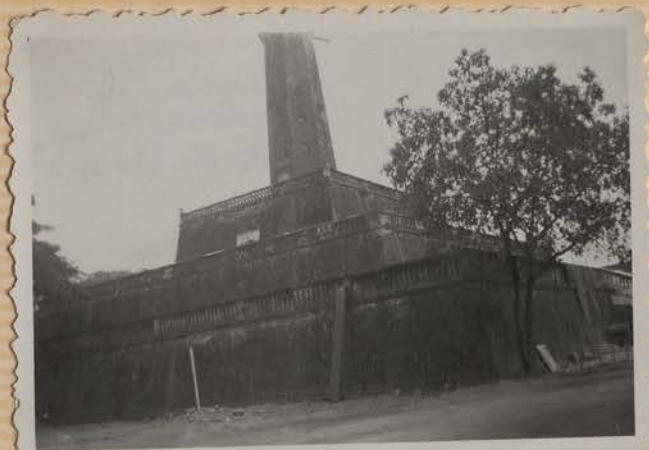
HANOI, juillet 1951.- Les terrasses qui remplacent l'ancienne butte Côt Cô.