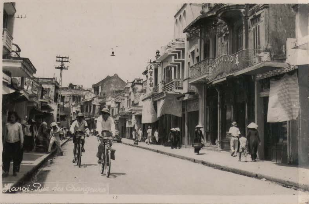
HANOI, 1953.- Rue des Changeurs (Carte Postale Lumière).