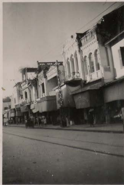
HANOI, septembre 1951.- Rue de la Soie.