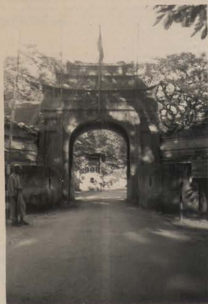
HANOI, aout 1951.- L'une des entrées à l'intérieur de l'enceinte de la Pagode Royale.