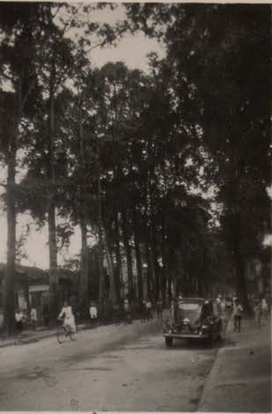
HANOI.- août 1951.- Bd. Armand Rousseau (taille des arbres).