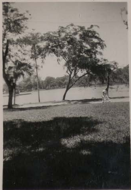
HANOI, 9 juin 1950.- Le Petit Lac.