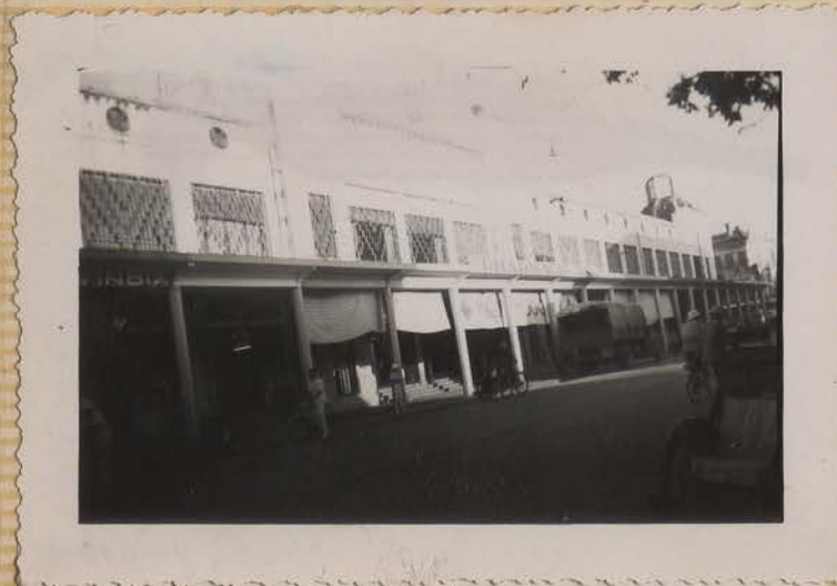
HANOI, juillet 1951.- Bd. Dong-Khanh.