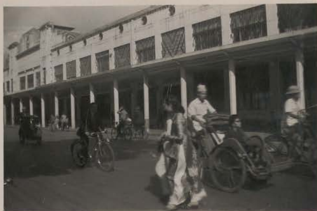
HANOI, 27 janvier 1952.- Bd. Dong Khanh.