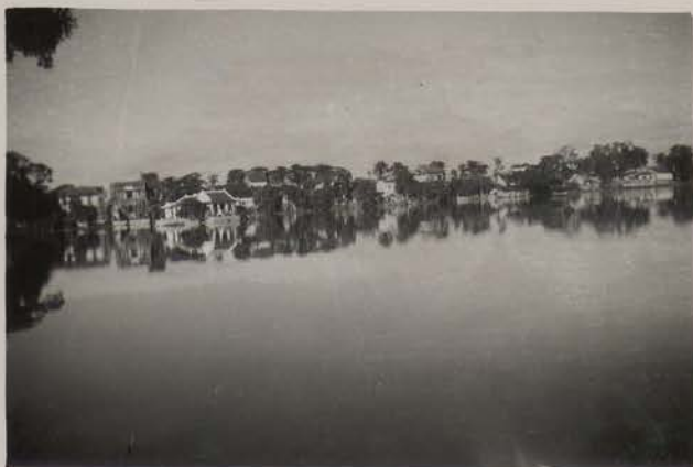
HANOI, septembre 1950.- Lac Truc Bach.