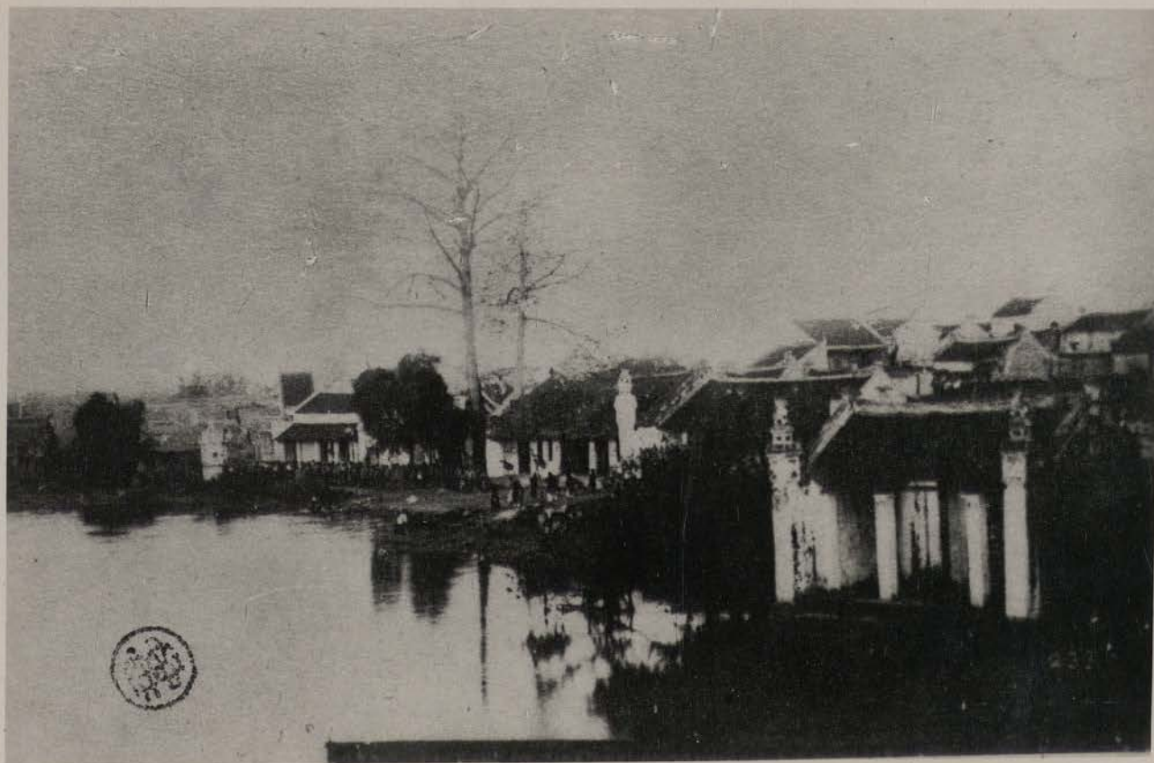
HANOI, 1883.- Bord du Petit Lac (Arch. et Bibliothèques Est A. 33).