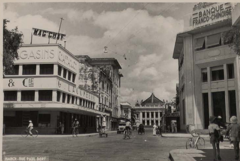
HANOI, 1953.- La rue Paul Bert (Carte Postale Lumière).