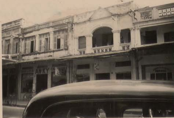
HANOI, avril 1952.- Rue Paul B ert.