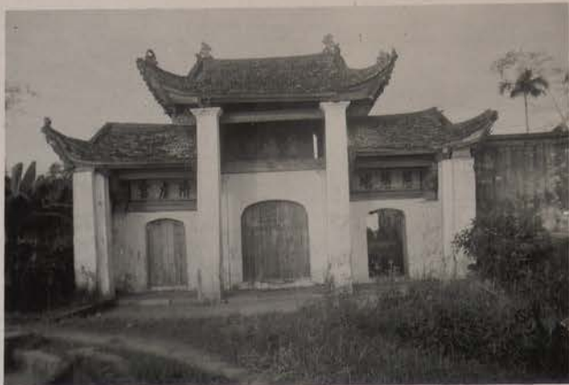
HANOI, septembre 1953.- Portail d'entrée de la Résidence du Maire du Palais au bord du Grand Lac (XVIII o s).