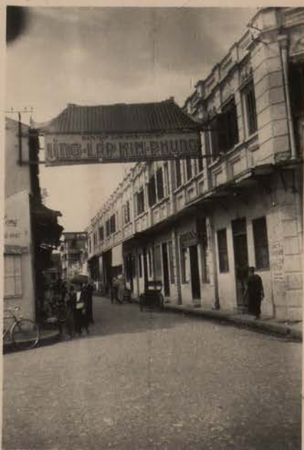
HANOI, mai 1952.- Rue Géraud.