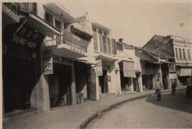
HANOI, avril 1952.- Rue des Pavillons Noirs.