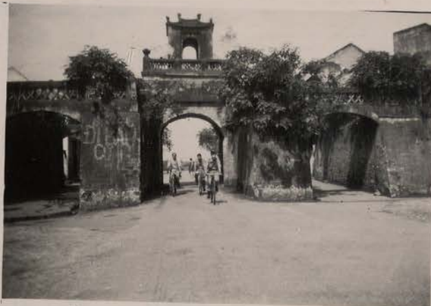
HANOI, mai 1951.- Porte Jean Dupuis.