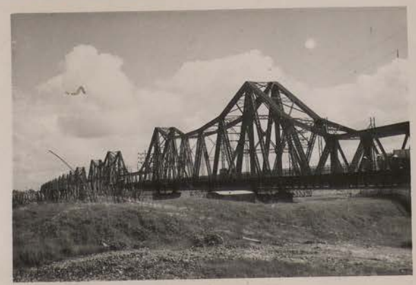
HANOI.- Le Pont Doumer.