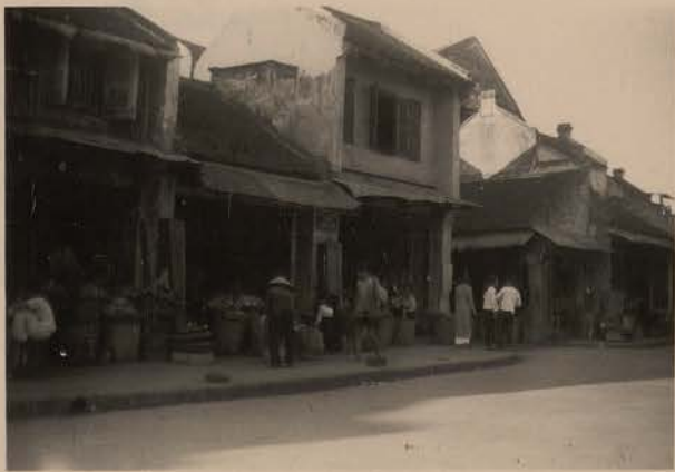
HANOI, juin 1952.- Rue de la Saumure.