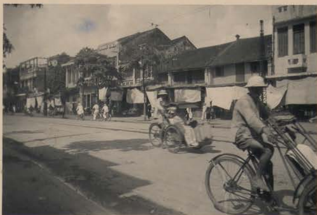
HANOI, 2 juillet 1952.- La rue Duy Tam.