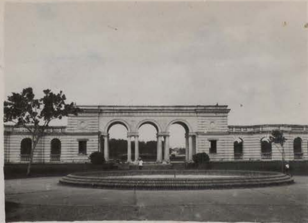
HANOI, 1952.- Le Rond Point de France.