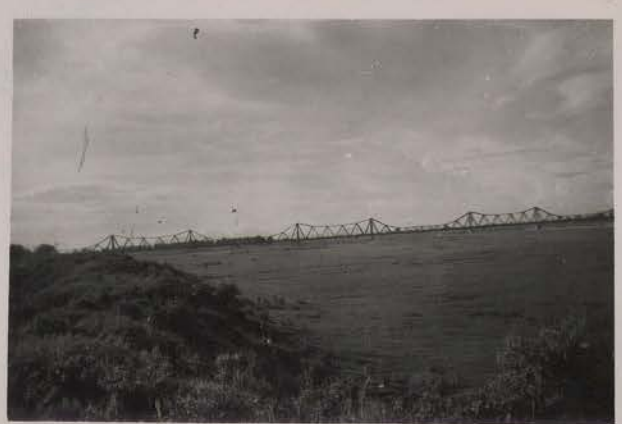
HANOI, 31 juillet 1951.- Le Pont Doumer.