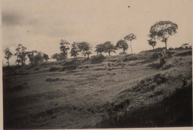
HANOI, juin 1952.- L'ancien rempart en arrivant au Village de Papier par la digue "Pancan".