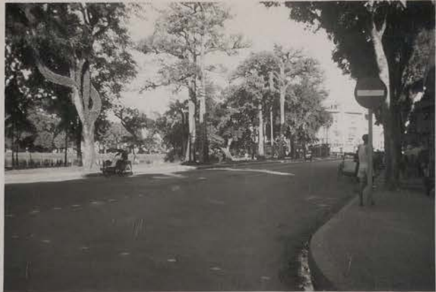
Hanoi, septembre 1953.- Rue Paul Bert