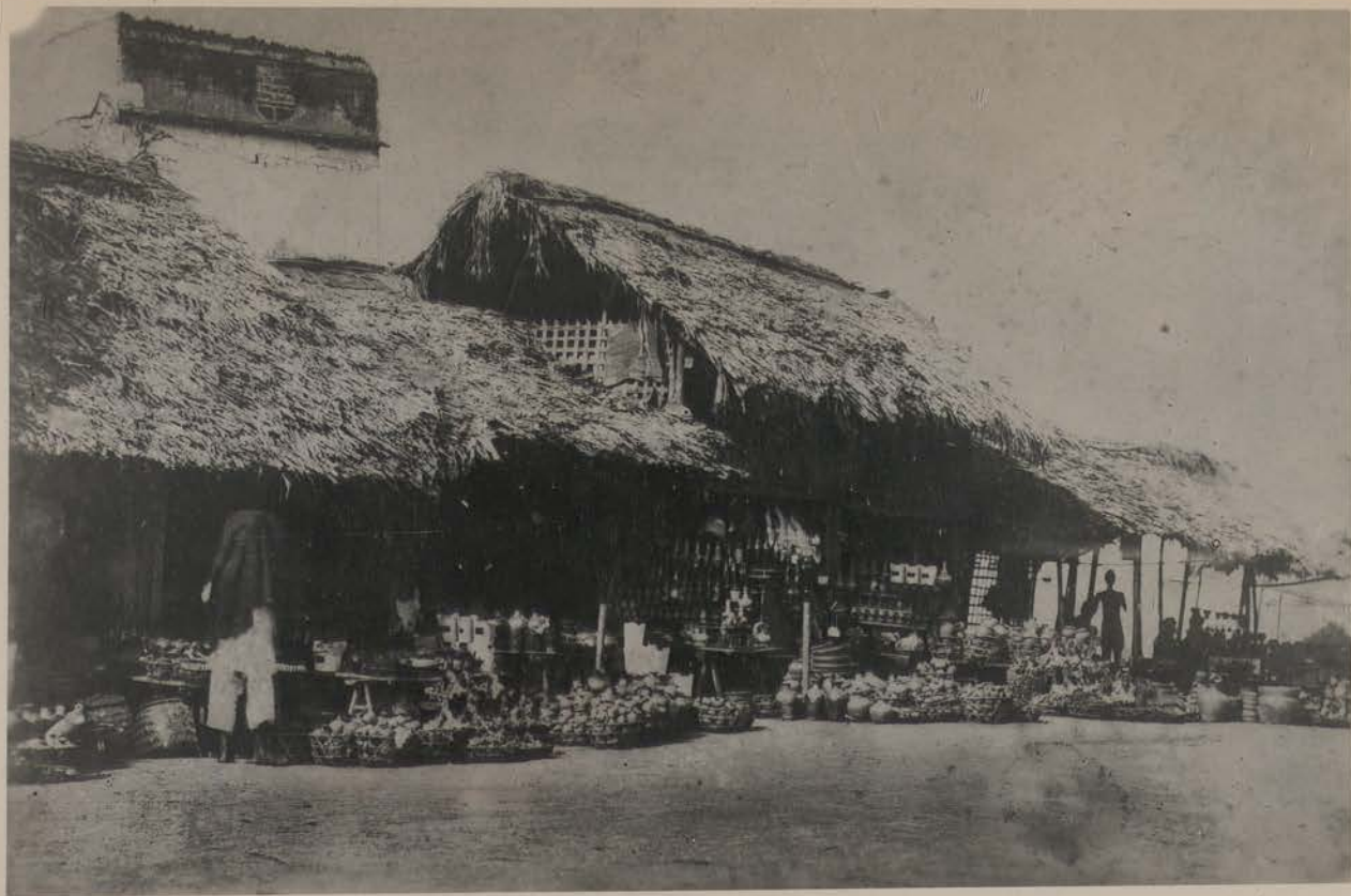
HANOI, 1883.- Rue de la Poterie.