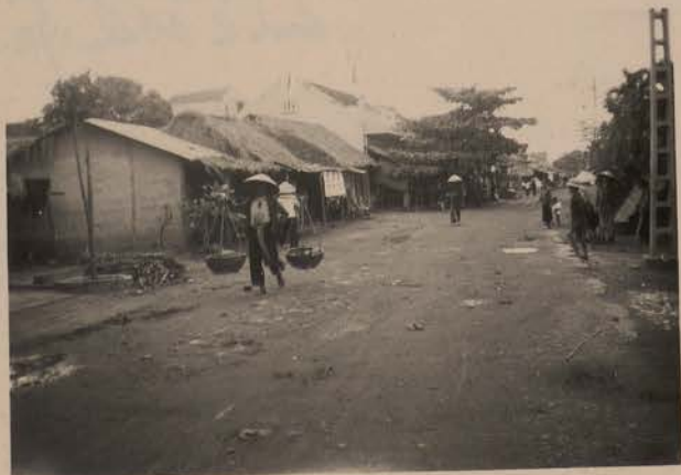
HANOI, juin 1952.- Sur la digue qui borde le Grand Lac.