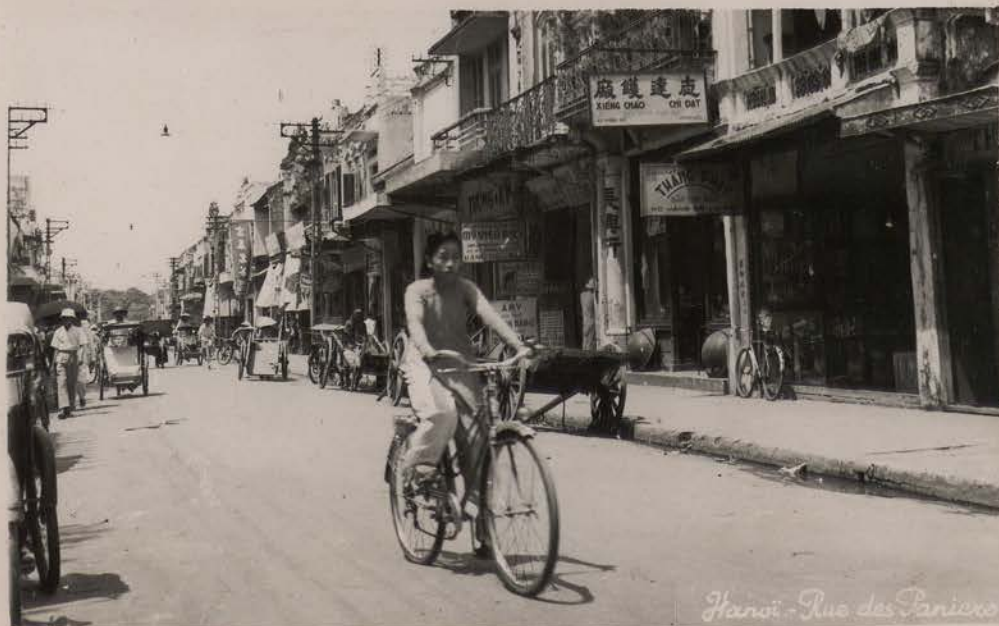
HANOI.- Rue des Paniers (Carte Postale Lumière).