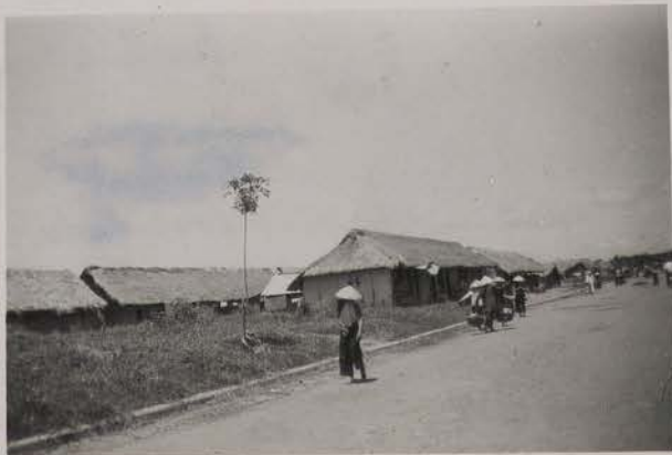
HANOI, 14 août 1951.- Perspective sur la rue du Résident Miribel (S. du lac).