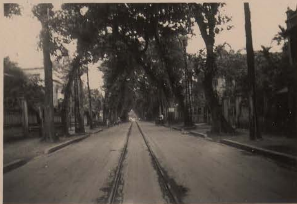
HANOI, juin 1952.- La rue du Grand Bouddha.