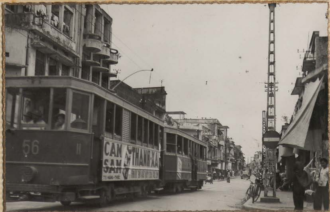
HANOI.- Rue du Sucre (Carte Postale, Indochine-Photo-Studio).