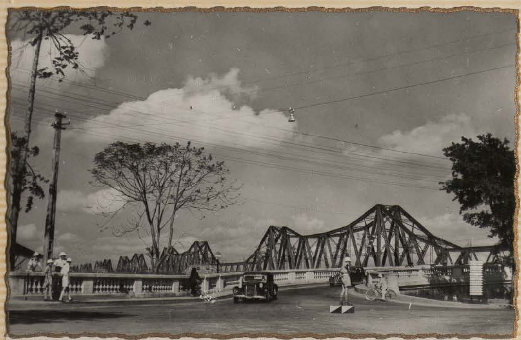
HANOI.- Pont Doumer.