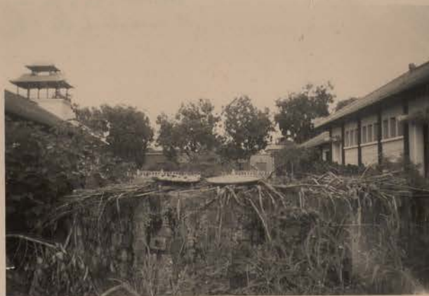
HANOI, juin 1952.- Derniers vestiges de l'enceinte de la citadelle.