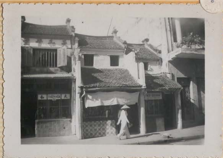
HANOI, 10 juillet 1954.- Rue des Changeurs.