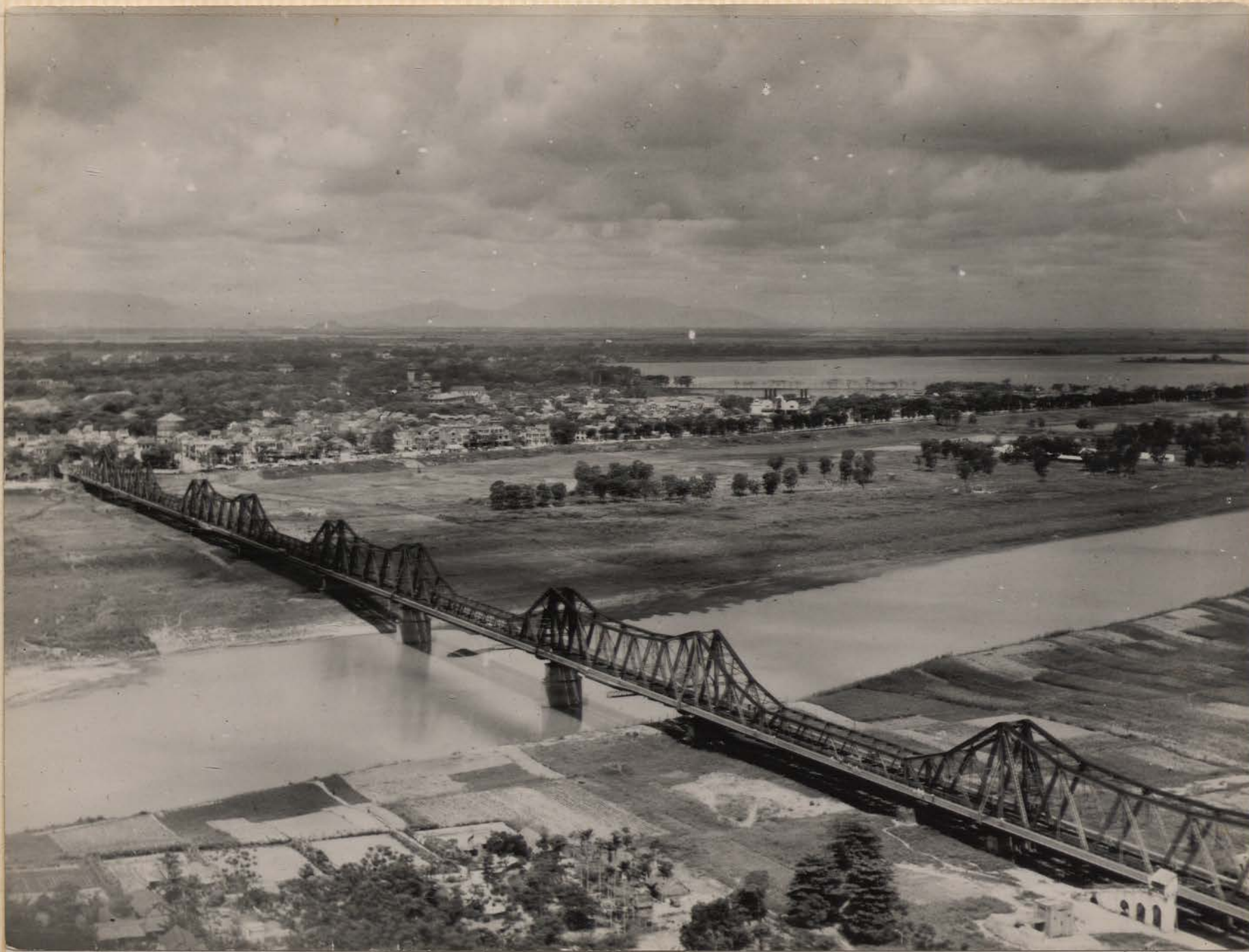
HANOI, mai 1951.- Le Pont Doumer.- Au 1 o plan, à gauche, l'île et le village de Phuc Xa.- Le Grand Lac.- L'Eglise des Martyrs.