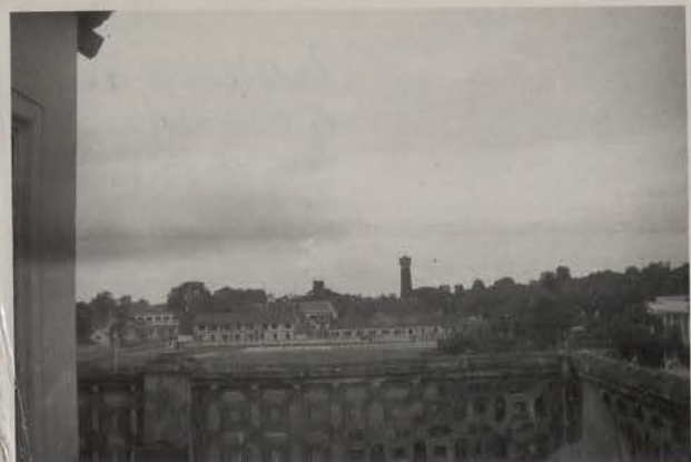
HANOI, juillet 1951.- La citadelle, vue vers le mirador, prise du haut de la porte Sud de l'enceinte royale.