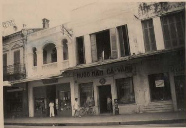
HANOI, avril 1952.- Rue Paul Bert.