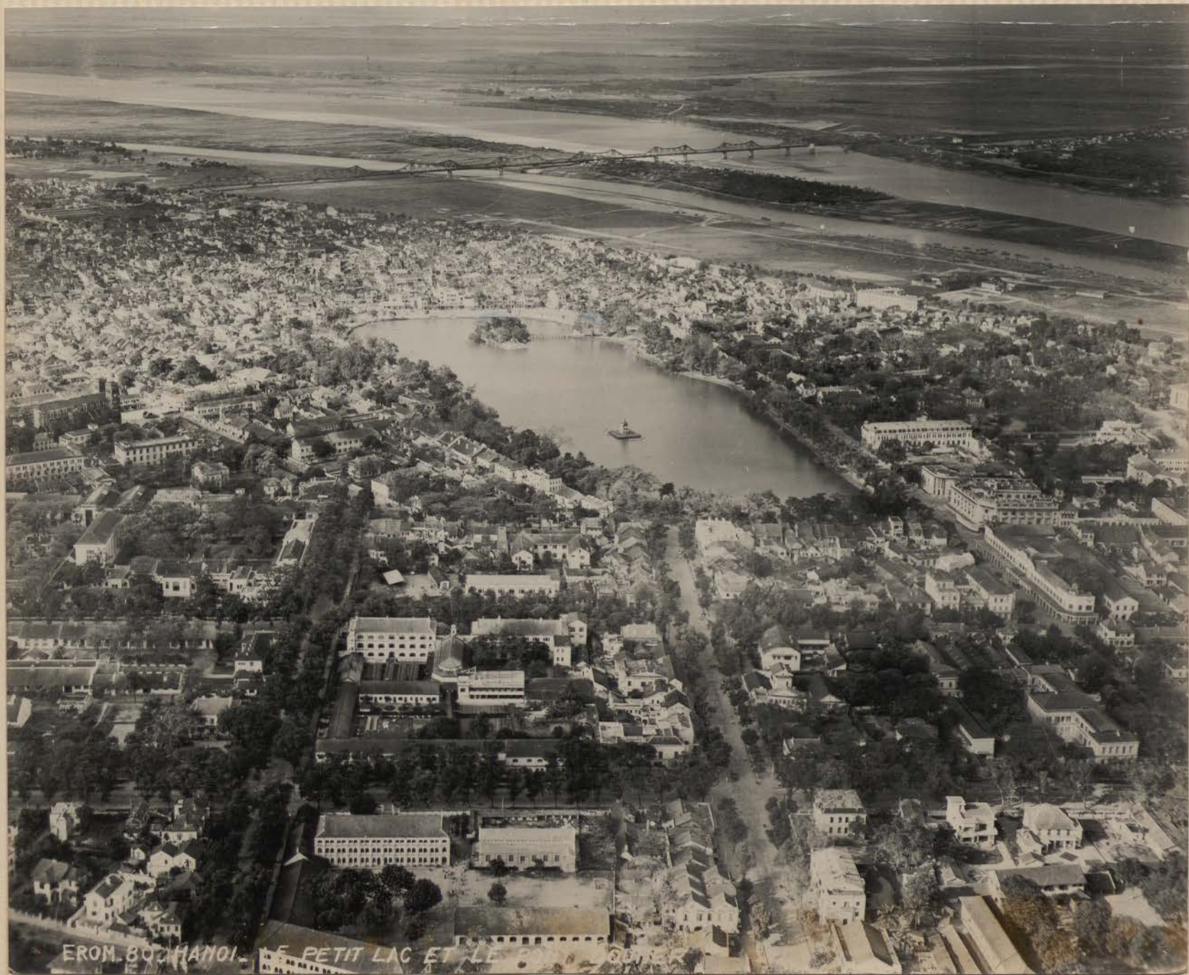
EROM. 80. HANOI. - LE PETIT LAC ET LE PONT DOUMER. (EROM 80).