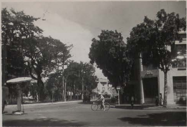
HANOI, 30 août 1954.- La rue d'Angleterre.