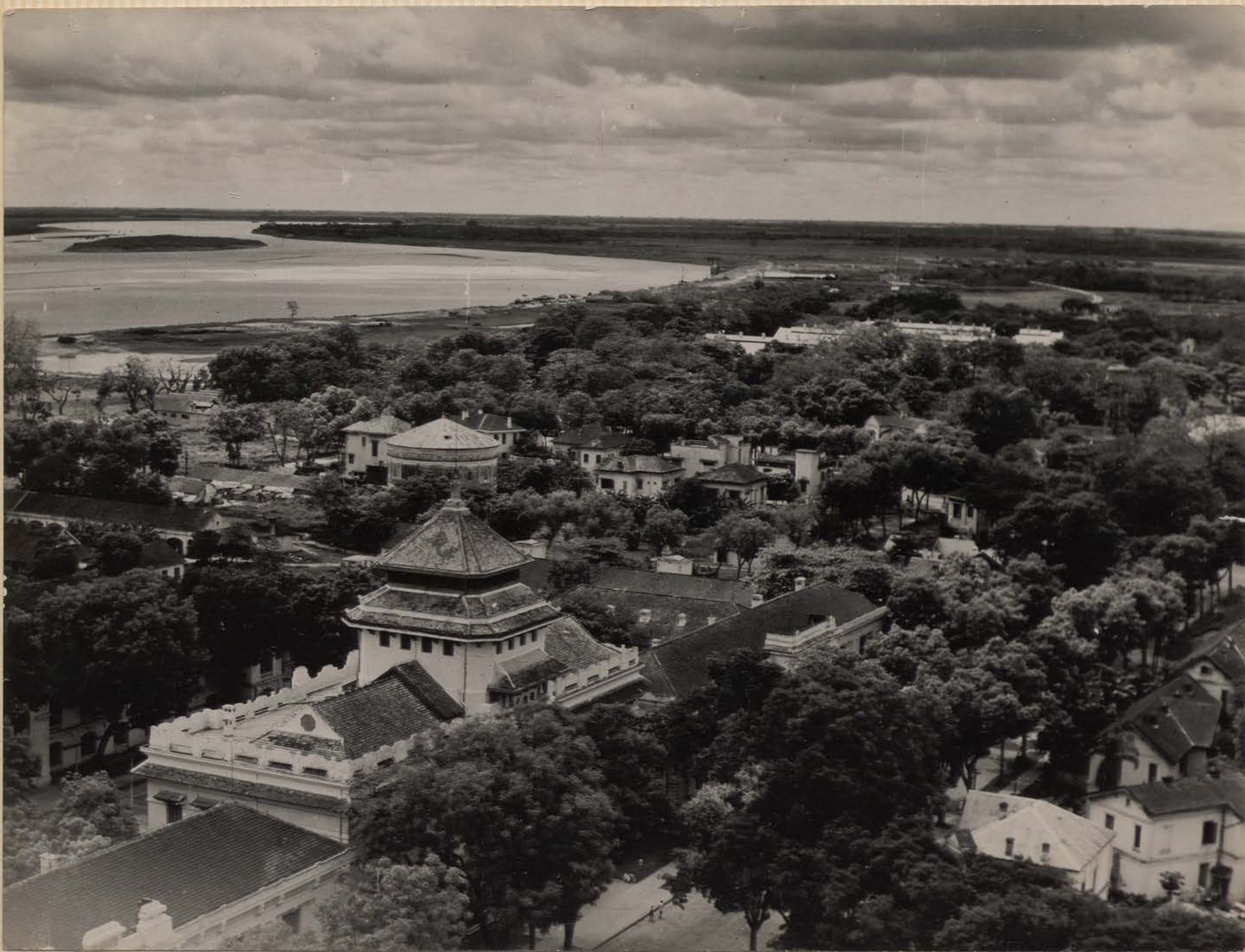
HANOI, mai 1951.- Le Fleuve Rouge, vers l'aval.-Au 1° plan, l'Université de Hanoi; au 3° plan, dans les arbres, le toits de l'hôpital Lanmassan.