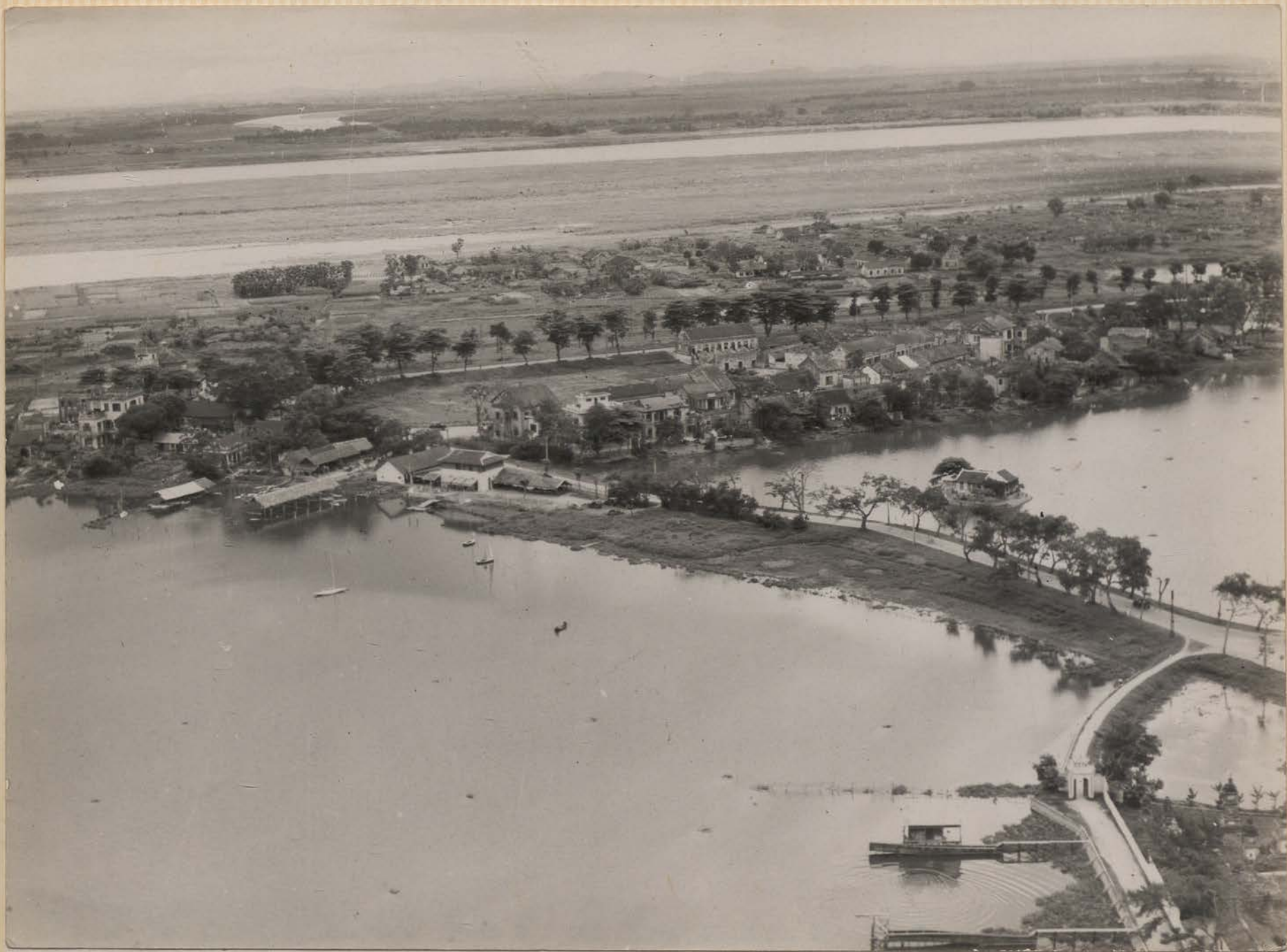
HANOI, mai 1951.- Le Fleuve Rouge et le Grand Lac (1 o plan à gauche).- Au premier plan, à droite, entrée de la pagode Chan Quôc.