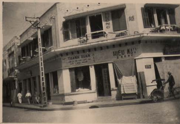
HANOI, avril 1952.- Angle de la rue Géraud et de la rue Nguyen Khuyen.