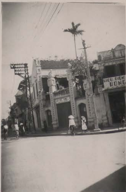
HANOI, août 1951.- Rue de la Poissonnerie.