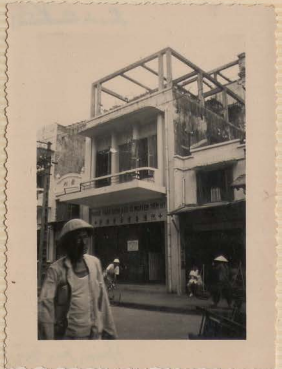
HANOI, juin 1952.- Rue des Voiles