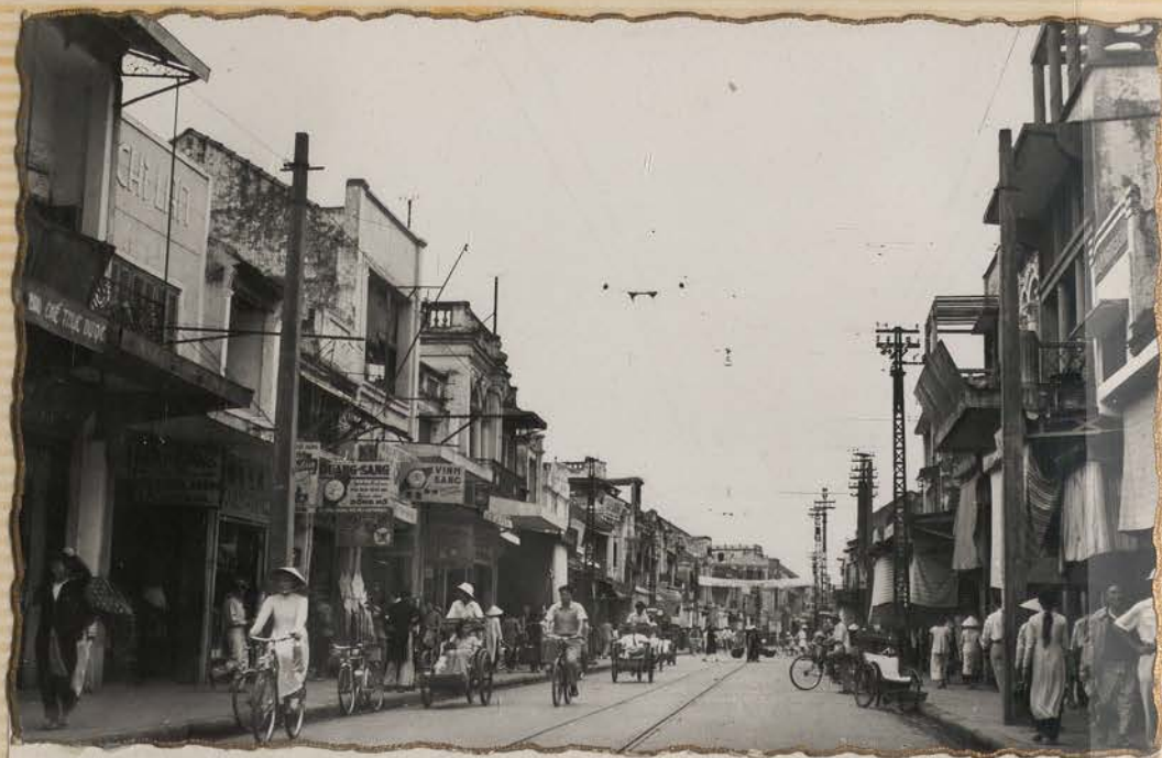
HANOI, 1951.- Rue des Cantonais.