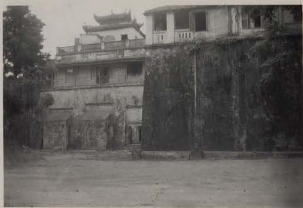
HANOI, juillet 1951.- La Citadelle : Porte Sud de l'enceinte royale.