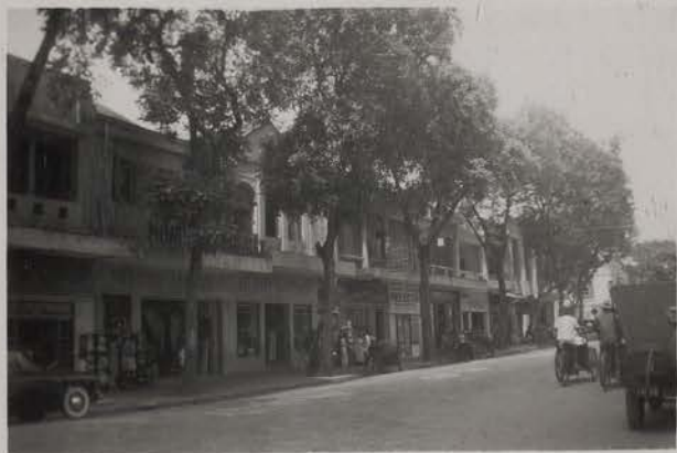
HANOI, mai 1951.- Rue Paul Bert (à hauteur du Patit Lac).