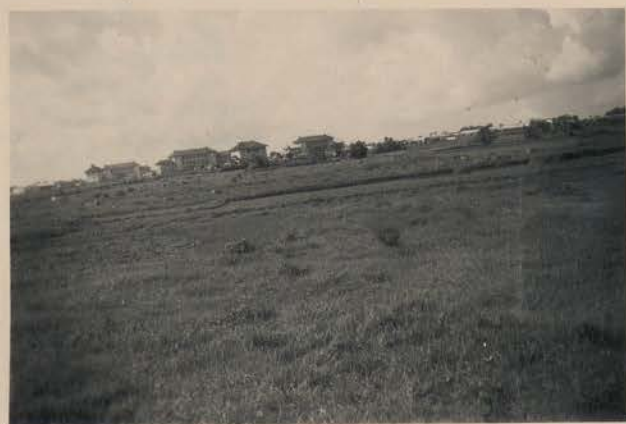
HANOI, 2 juillet 1952.- Route circulaire sur la digue.- Vue prise sur la Cité Universitaire entre la route de Huê et Luong Yên.