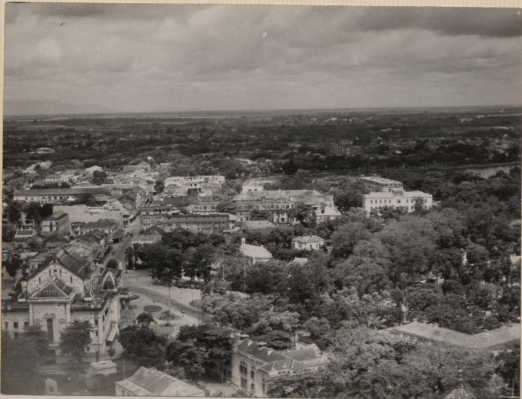
HANOI, mai 1951.- Le théâtre et la Rue Paul Bert.- Adroite, le Petit Lac.