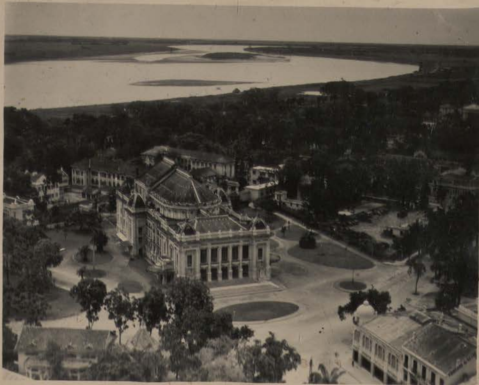
HANOI, 1951.- Le théâtre, le Fleuve Rouge et la zone de la première concession française.