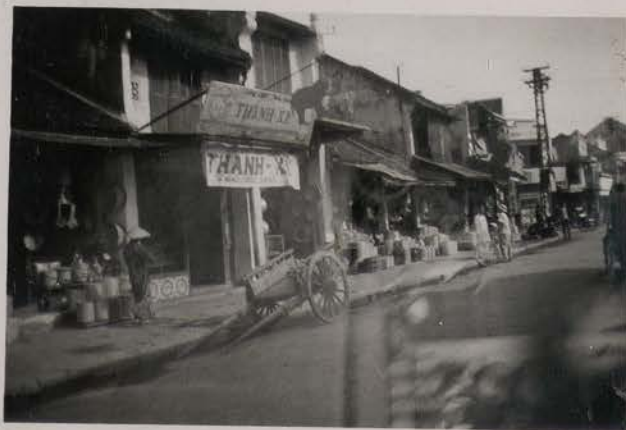
HANOI, juillet 1951.- La Rue des Ferblantiers.