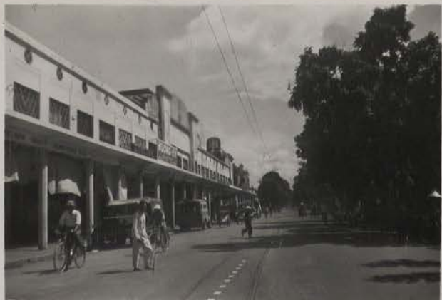
Hanoi, 30 aout 1954.- Boulevard Dong Khanh.