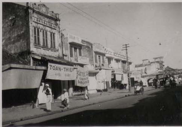
HANOI, 4 juillet 1953.- Rue du Papier.