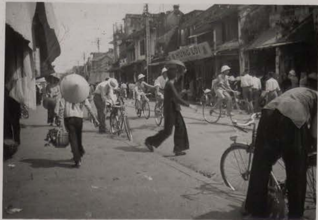
HANOI, juillet 1953.- Rue du Riz.