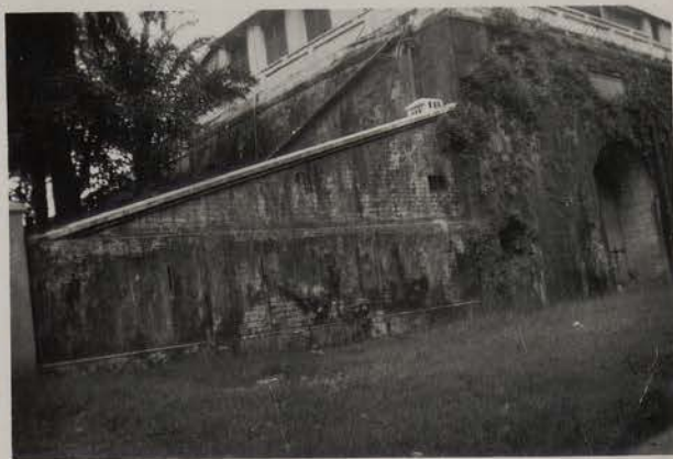
HANOI, juillet 1951.- La Citadelle, Porte Nord