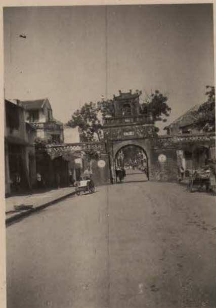
HANOI, avril 1952.- Porte Jean Dupuis (côté quai).