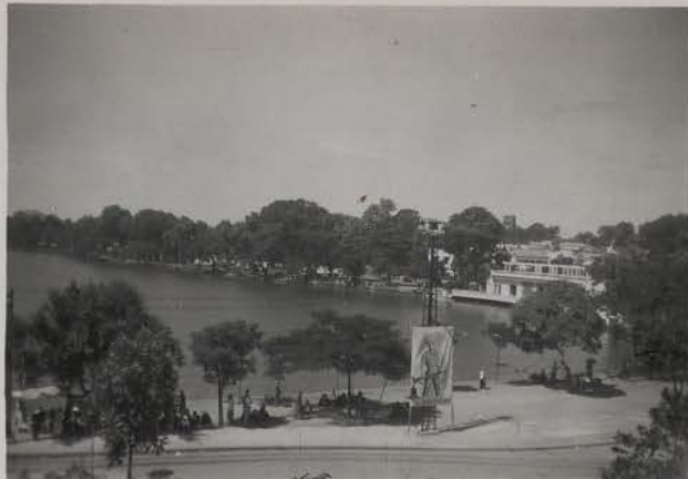
HANOI, 10 juillet 1954.- Le Petit Lac.