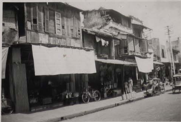
HANOI, août 1951.- Rue des Ferblantiers.