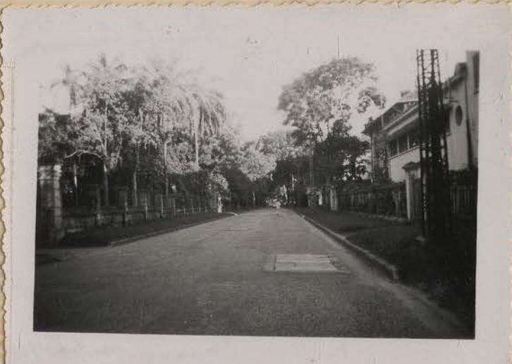
Hanoi, juillet 1951.- Rue de la Concession.