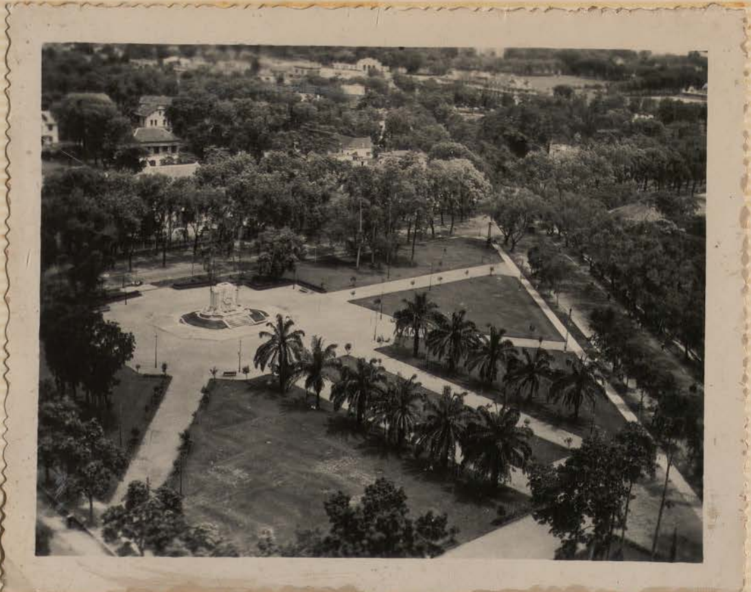
HANOI, 1951.- Le Bd. Borguis-Desbordes et le square au Monument aux Morts.