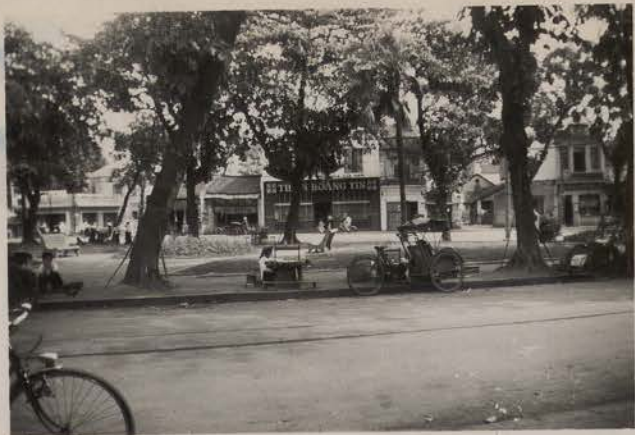
HANOI, avril 1952.- Place Neyret.