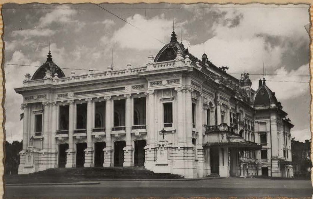
HANOI.- Le théâtre municipal (Carte postale Indochine Photo-Studio).