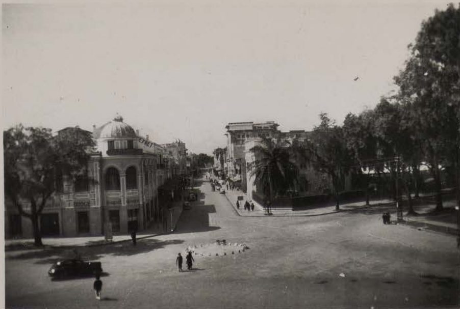
HANOI, février 1954.- La Rue Paul Bert.