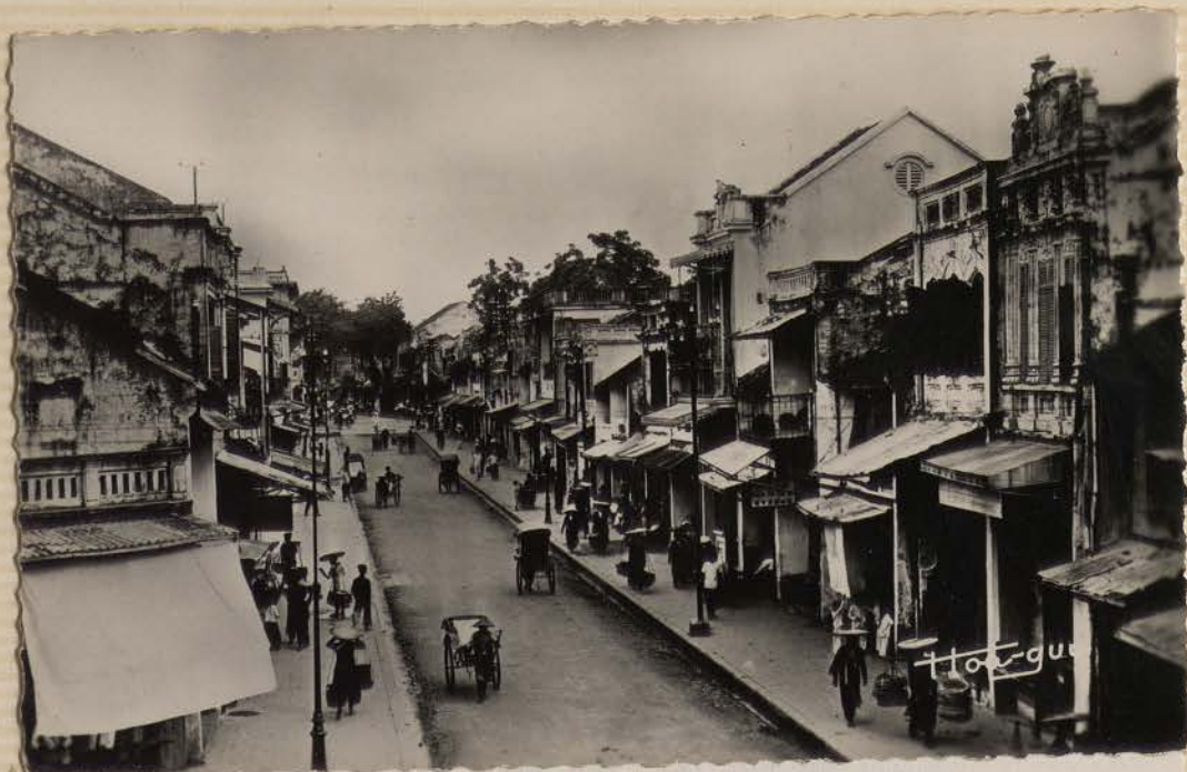
HANOI.- Une rue Vietnamienne (Carte Postale Bov).