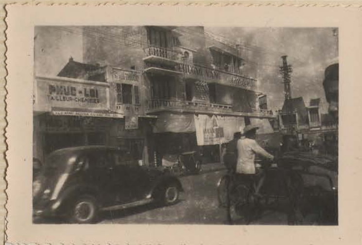
HANOI, mars 1953.- Rue du Chanvre (début).