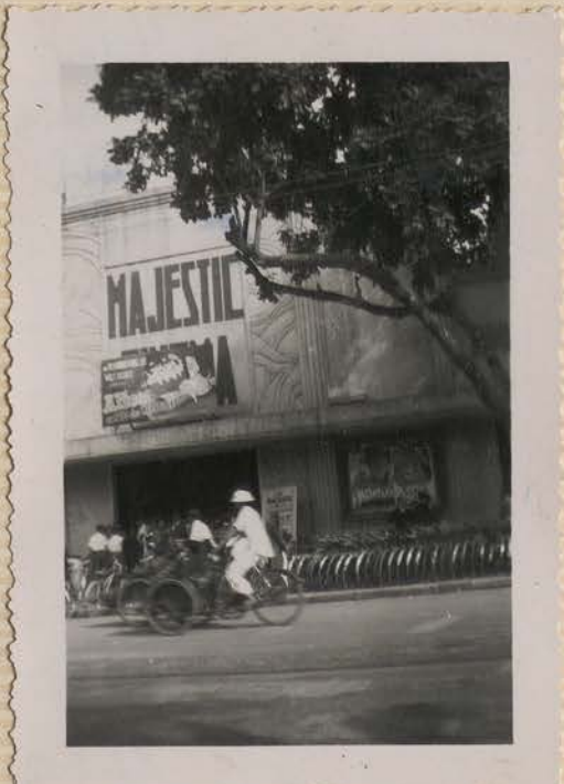
HANOI, 27 janvier 1952.- Bd. Dong Khanh, un des grands cinemas, le jour du Têt.