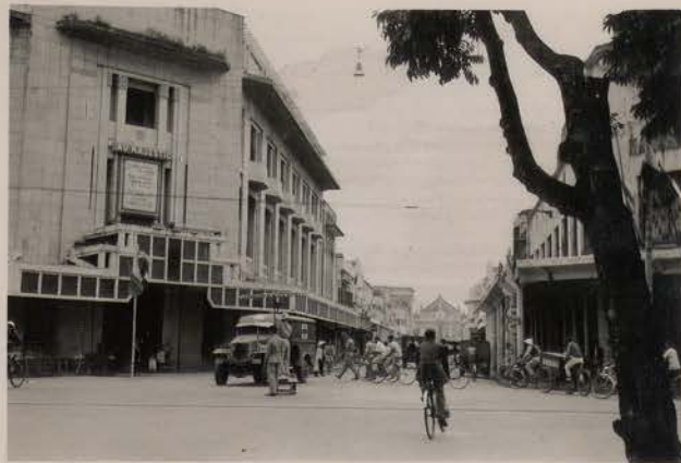
HANOI, 1952.- Rue Paul Bert.