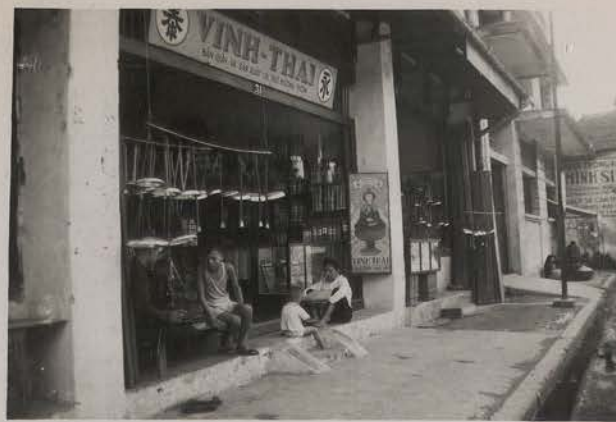
HANOI, août 1951.- La rue des Balances.