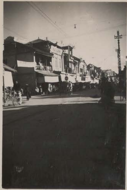
Hanoi, décembre 1950.- Rue de la Soie.