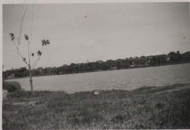
HANOI, 1 août 1951.- Lac Thiên Quang, vue vers le Nord-Est.