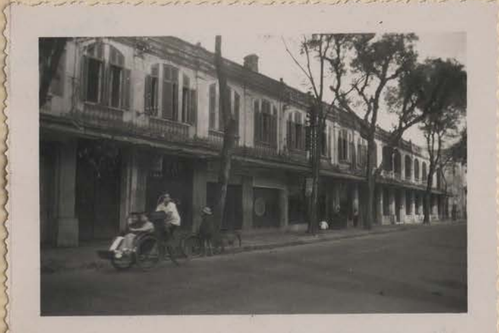
HANOI, 27 janvier 1952 (Têt).- La rue Borguis-Desbordes.