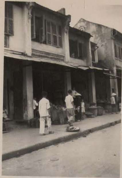
HANOI.- août 1951.- Rue de la Saumure.