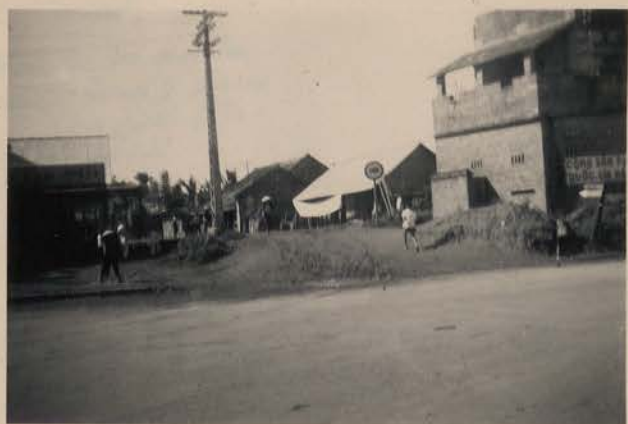
HANOI, 2 juillet 1952.- Amorce de la route circulaire sur la digue à Xa Dam vers Luong Yen.