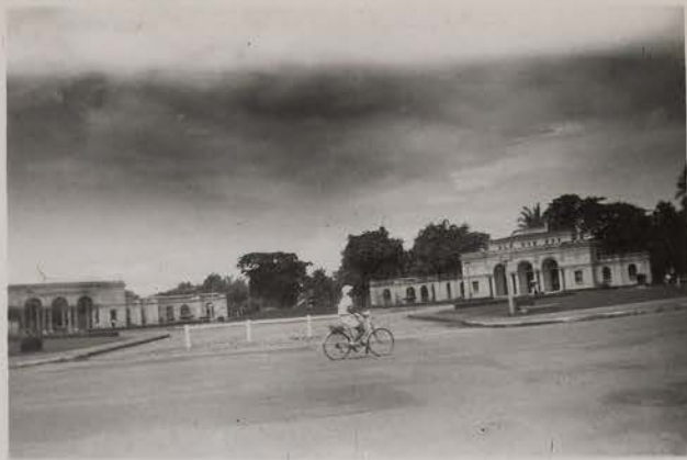
HANOI, 1951.- Le Rond-Point de France.