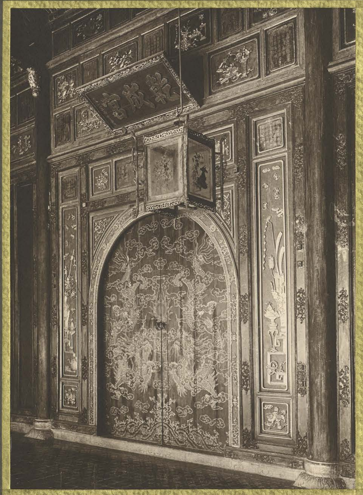
Hui. La Porte Dorée.

CENTRE DE DOCUMENTATION ET DE RECHERCHES SUR L'ASIE DU SUD-EST ET LE MONDE INDONESIEN BIBLIOTHEQUE