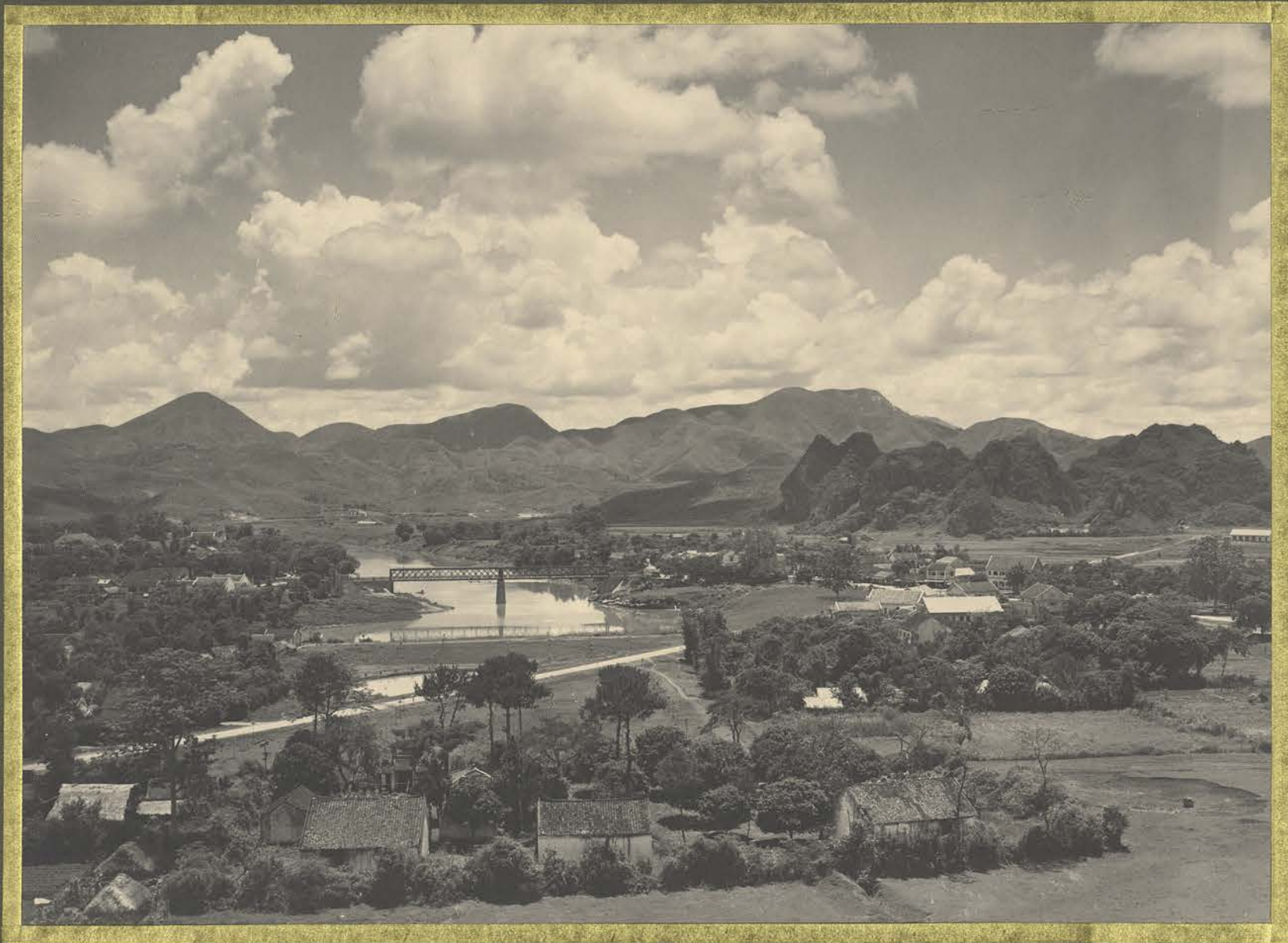
Lang-Son. Vue panoramique.