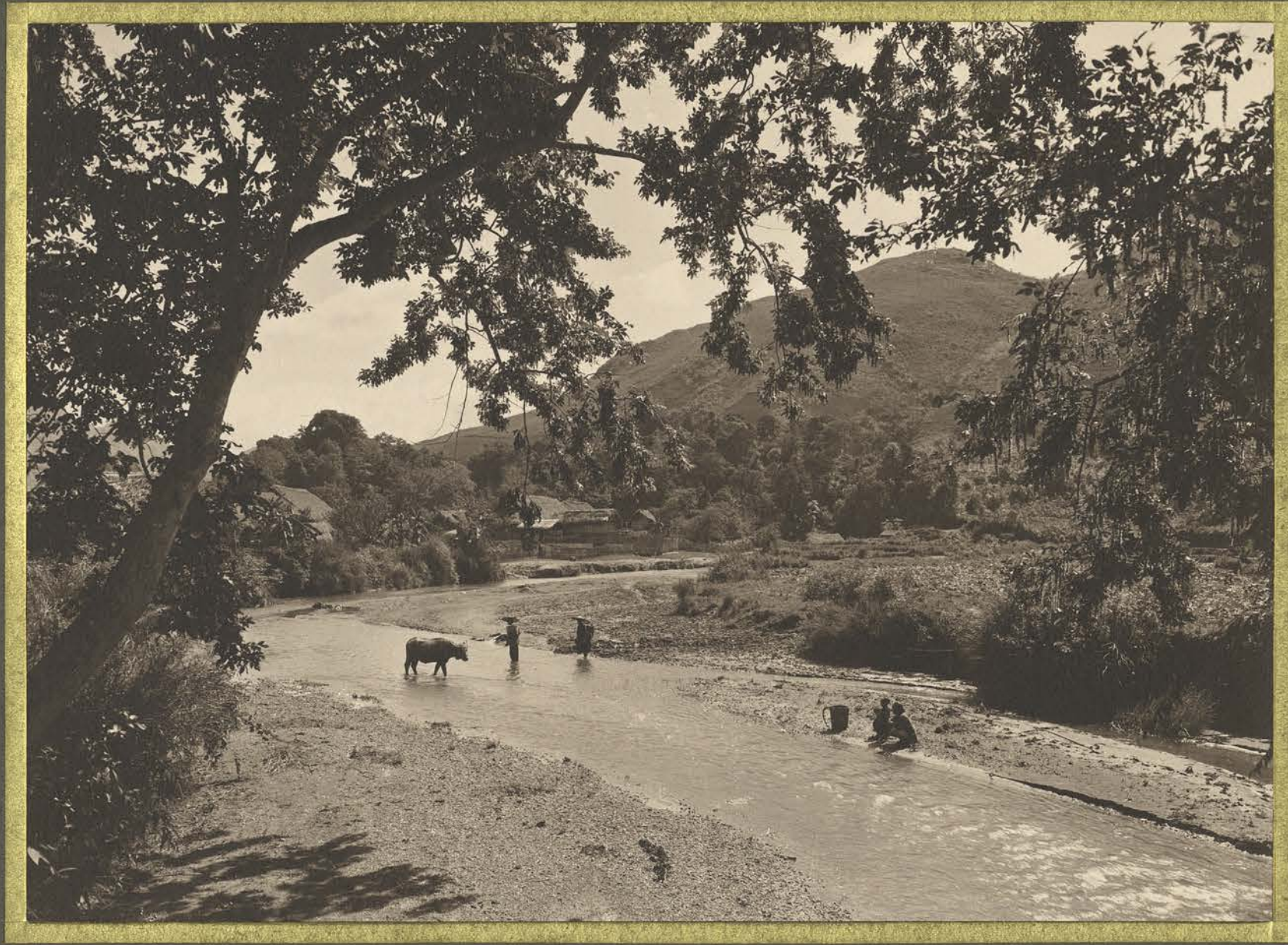
Takha. La rivière.

CENTRE DE DOCUMENTATION ET DE RECHERCHES SUR L'ASIE DU SUD-EST ET LE MONDE INDONESIEN BIBLIOTHEQUE