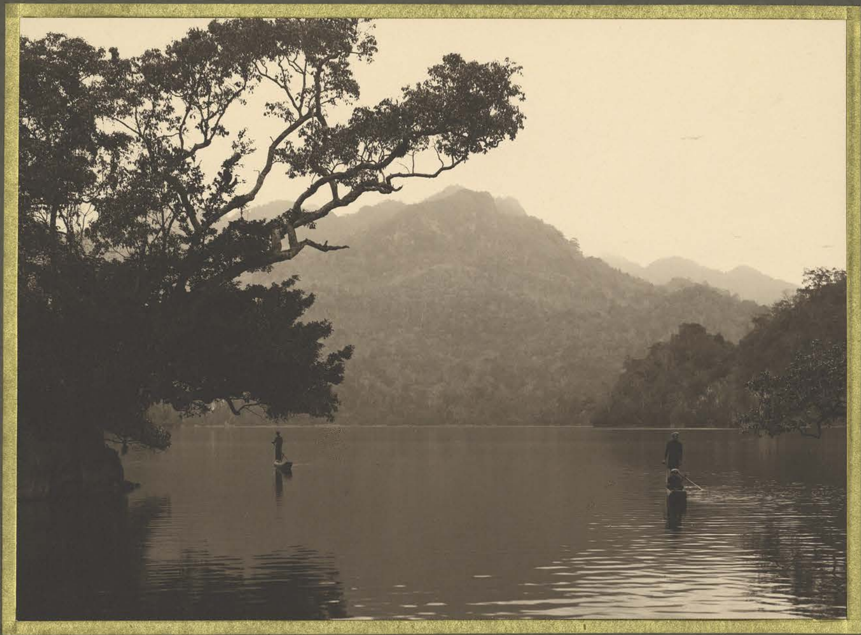
Bac-Hou. Les lacs Babé.