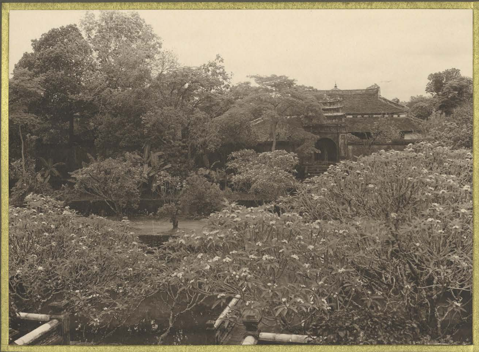
Huê . Tombeau de l'Empereur Minh-Mang . Les jardins .

CENTRE DE DOCUMENTATION ET DE RECHERCHES SUR L'ASIE DU SUD-EST ET LE MONDE INDONESIEN BIBLIOTHÈQUE