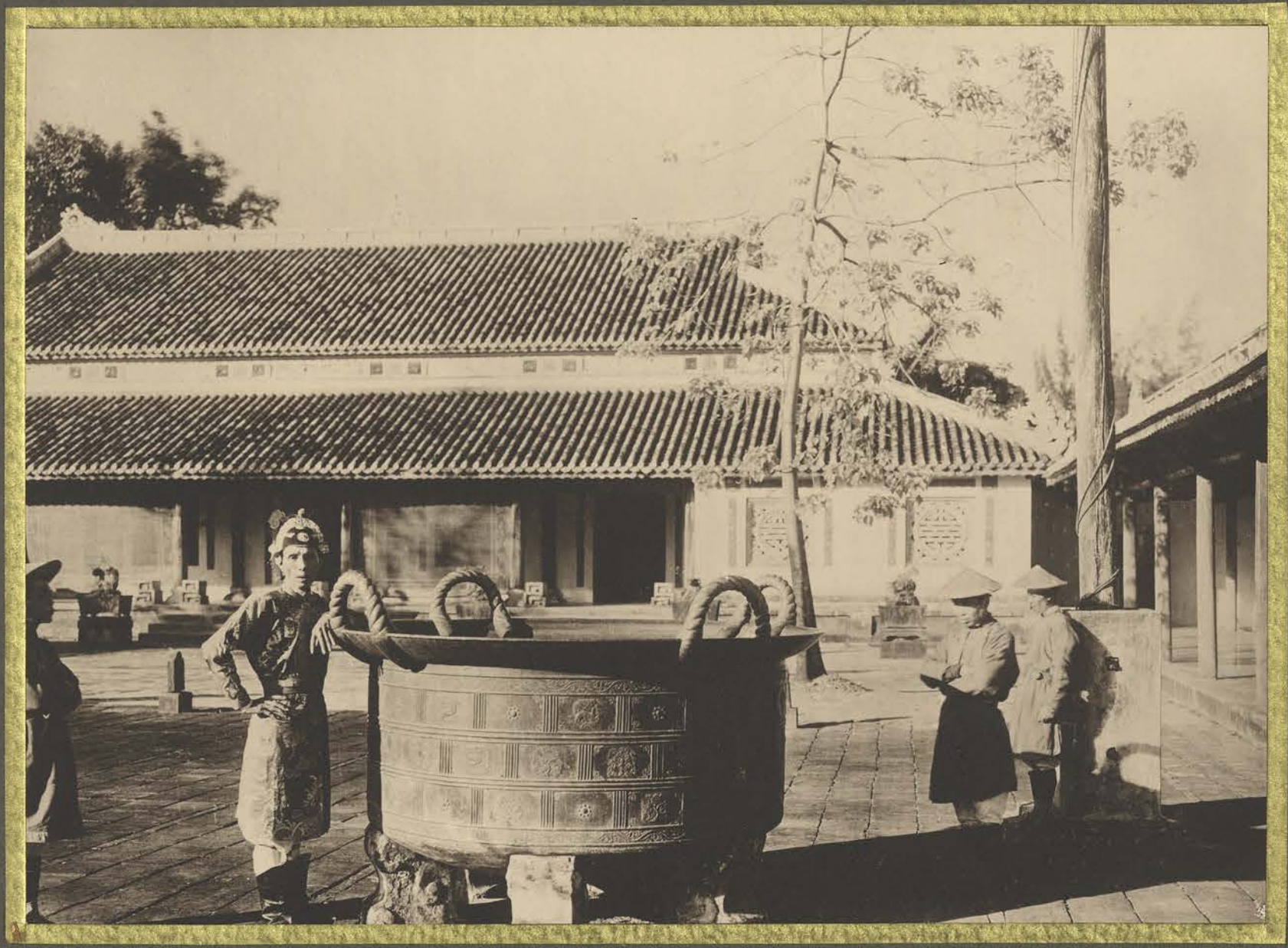
Hu. Une vasque en bronze.

CENTRE DE DOCUMENTATION ET DE RECHERCHES SUR L'ASIE DU SUD-EST ET LE MONDE INDONESIEN BIBLIOTHÈQUE