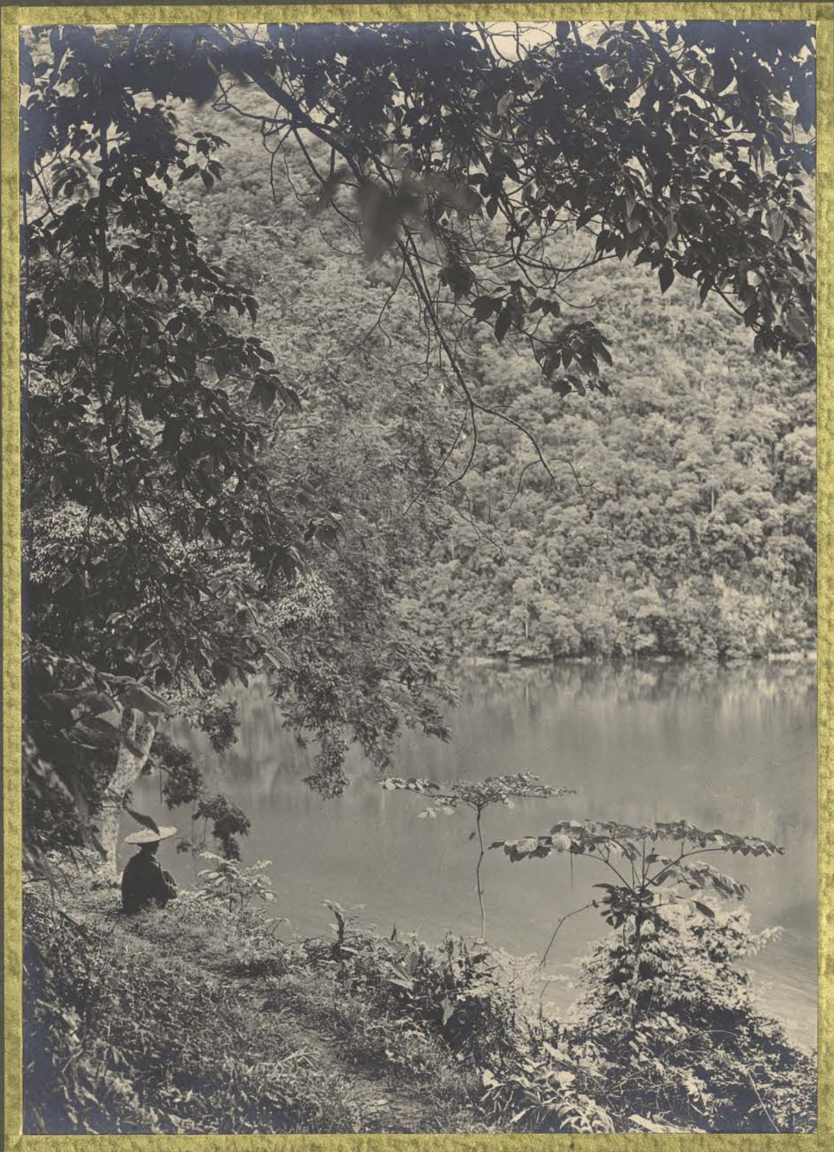
Béc-Hou. Les lacs Babé.

CENTRE DE DOCUMENTATION ET DE RECHERCHES SUR L'ASIE DU SUD-EST ET LE MONDE INDONESIEN BIBLIOTHÈQUE