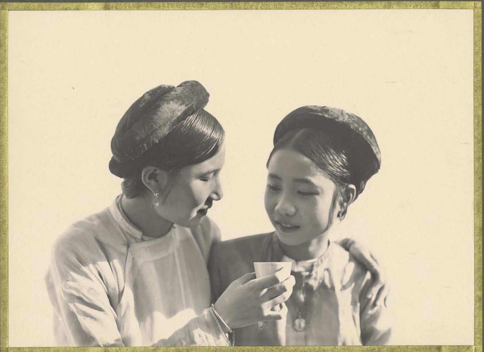
Hanoi. Jeunes Cochinoises.