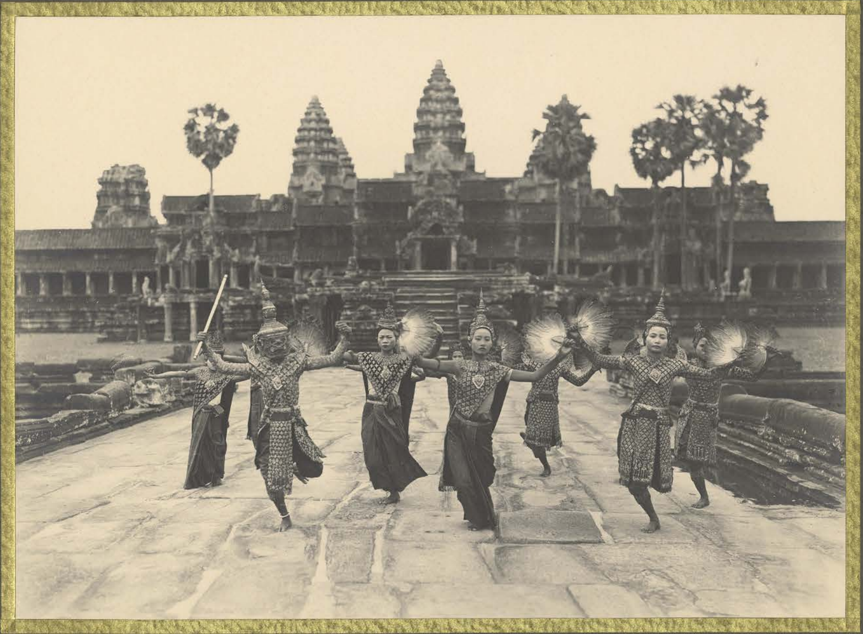
Angkor. Danseuses Cambodgiennes.

CENTRE DE DOCUMENTATION ET DE RECHERCHES SUR L'ASIE DU SUD-EST ET LE MORDE INDONESIEN BIBLIOTHÈQUE