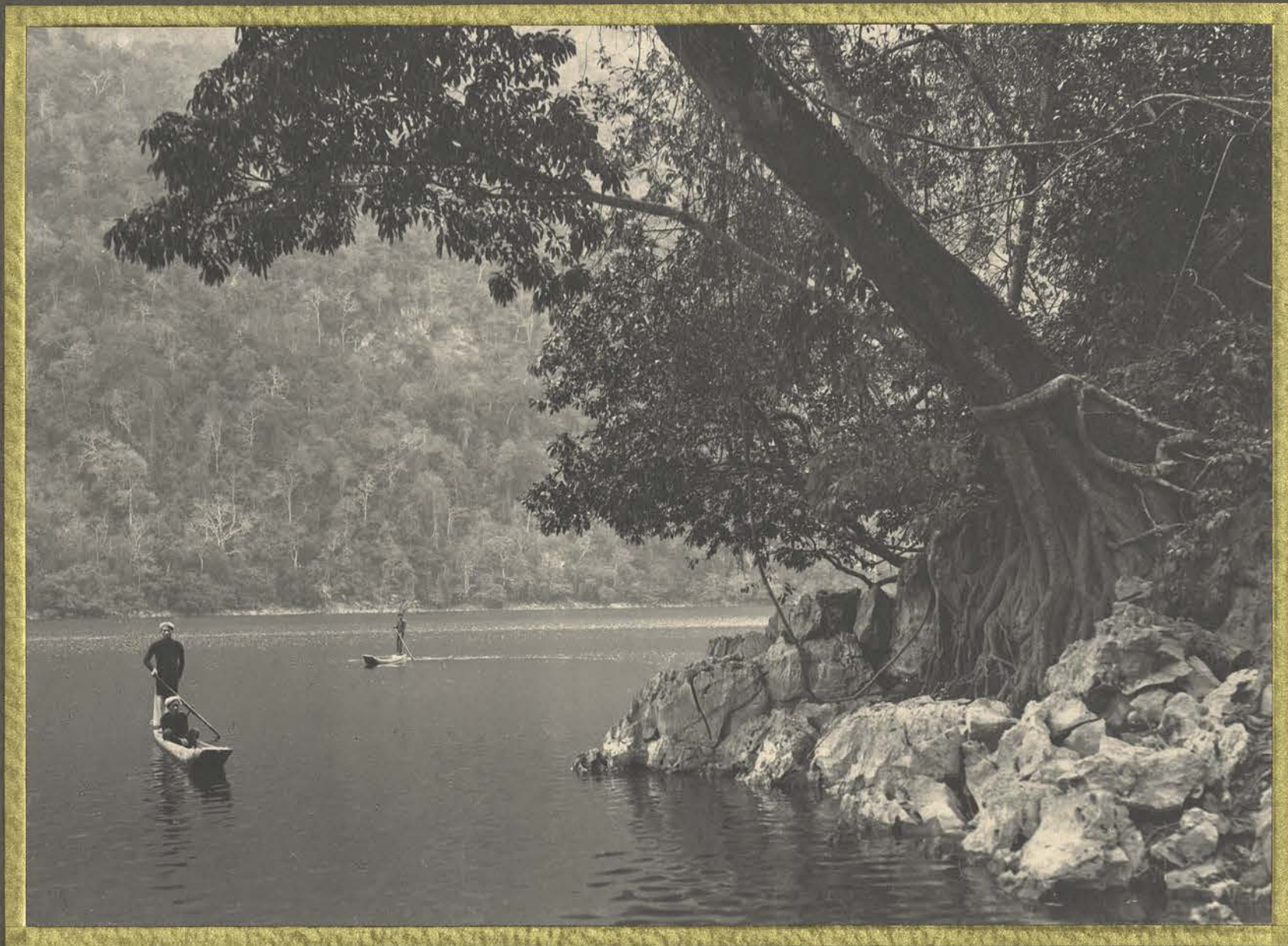
Bae-Kan. Les lacs Bobé.