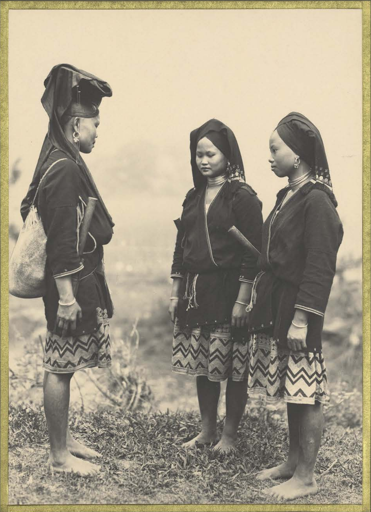
Suyut. Femmes Malin.

CENTRE DE DOCUMENTATION ET DE RECHERCHES SUR L'ASIE DU SUD-EST ET LE MONDE INDONESIEN BIBLIOTHEQUE