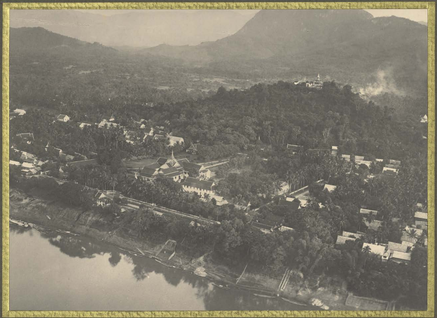
Luang Prabang. Palais Imperial et pagode du Kou-Si.