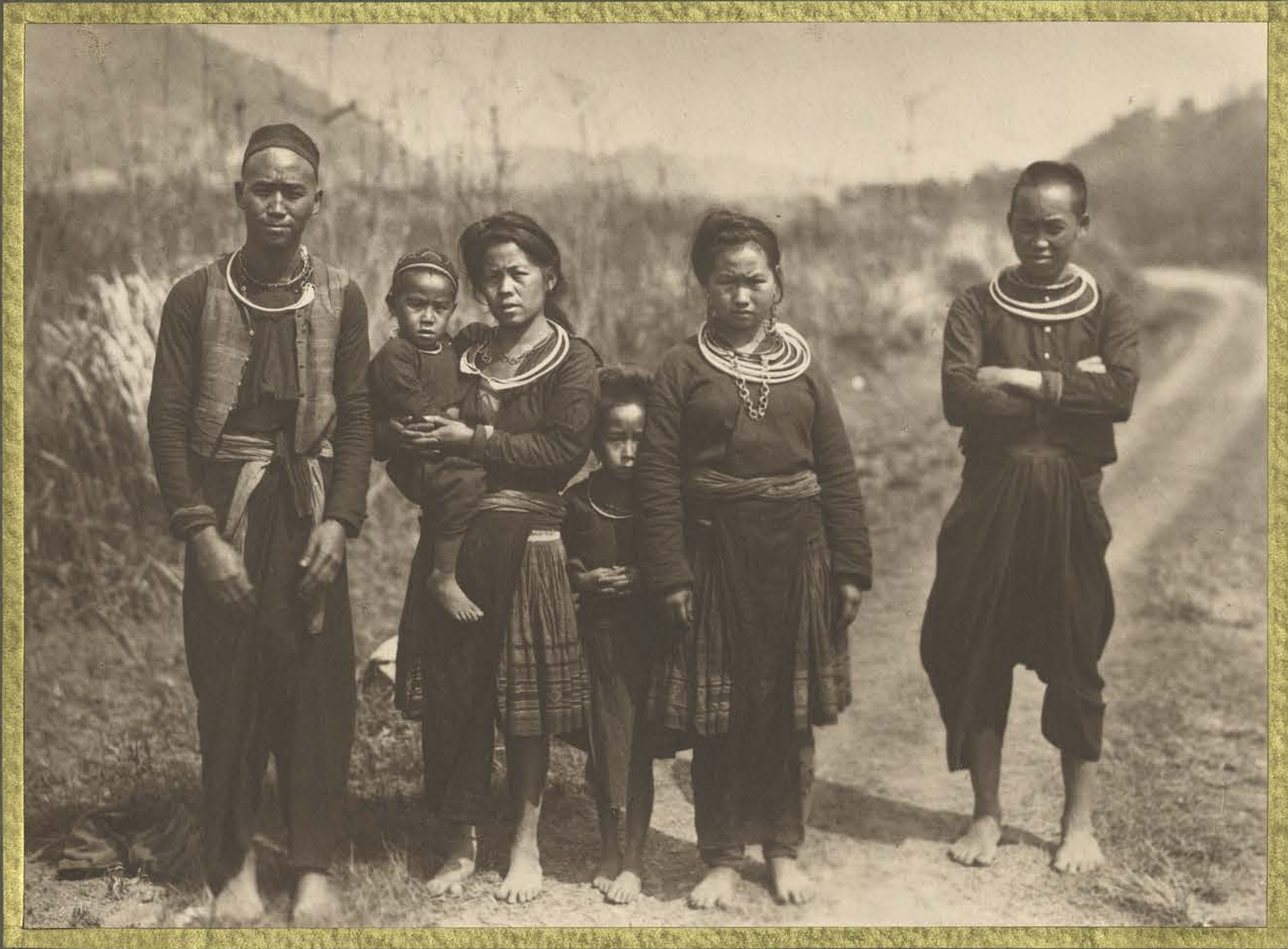
Cran-Ninh. Gypsies de Miao.

CENTRE DE DOCUMENTATION ET DE RECHERCHES SUR L'ASIE DU SUD-EST ET LE MONDE INDONESIEN BIBLIOTHEQUE