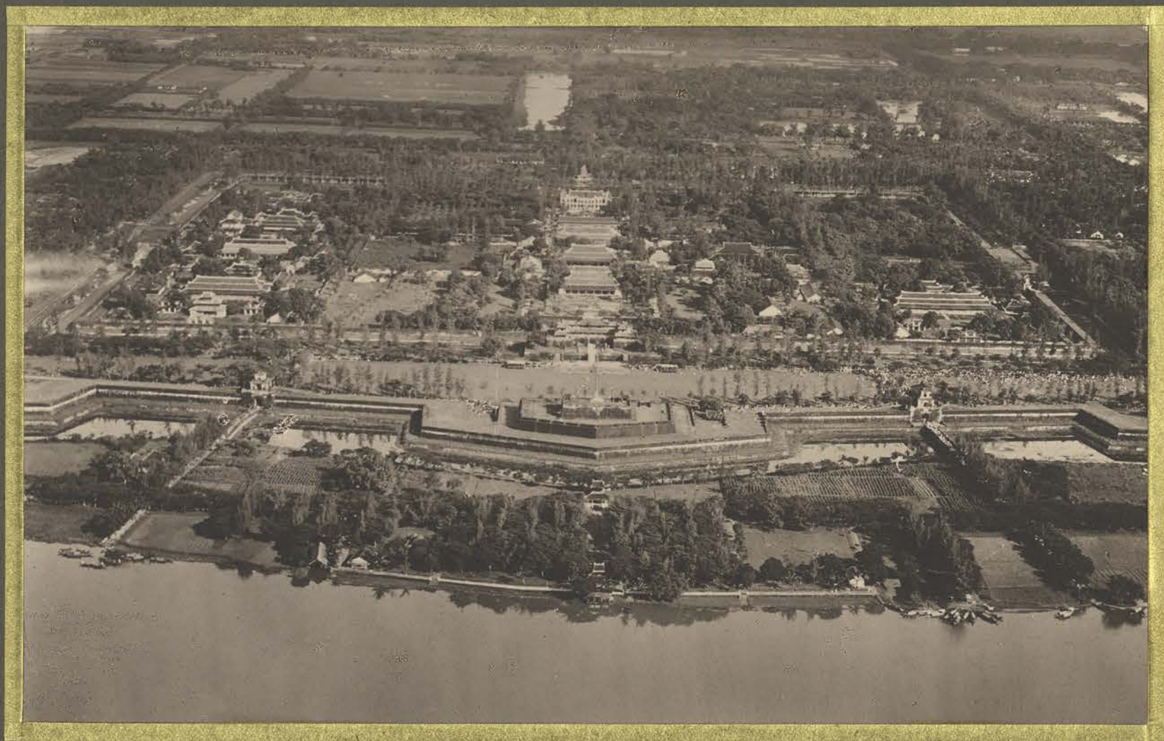
Hue. Palais Impérial.

CENTRE DE DOCUMENTATION ET DE RECHERCHES SUR L'ASIE DU SUD-EST ET LE MONDE INDONESIEN BIBLIOTHÈQUE