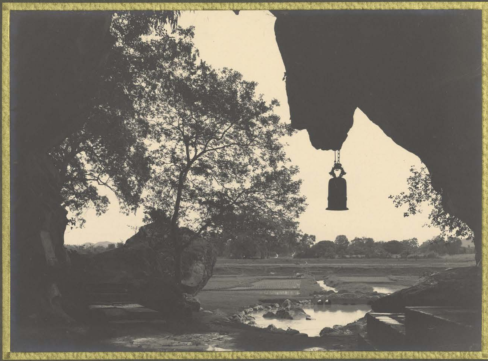
Lang-Son . Grotte de Nhi-Chanh .