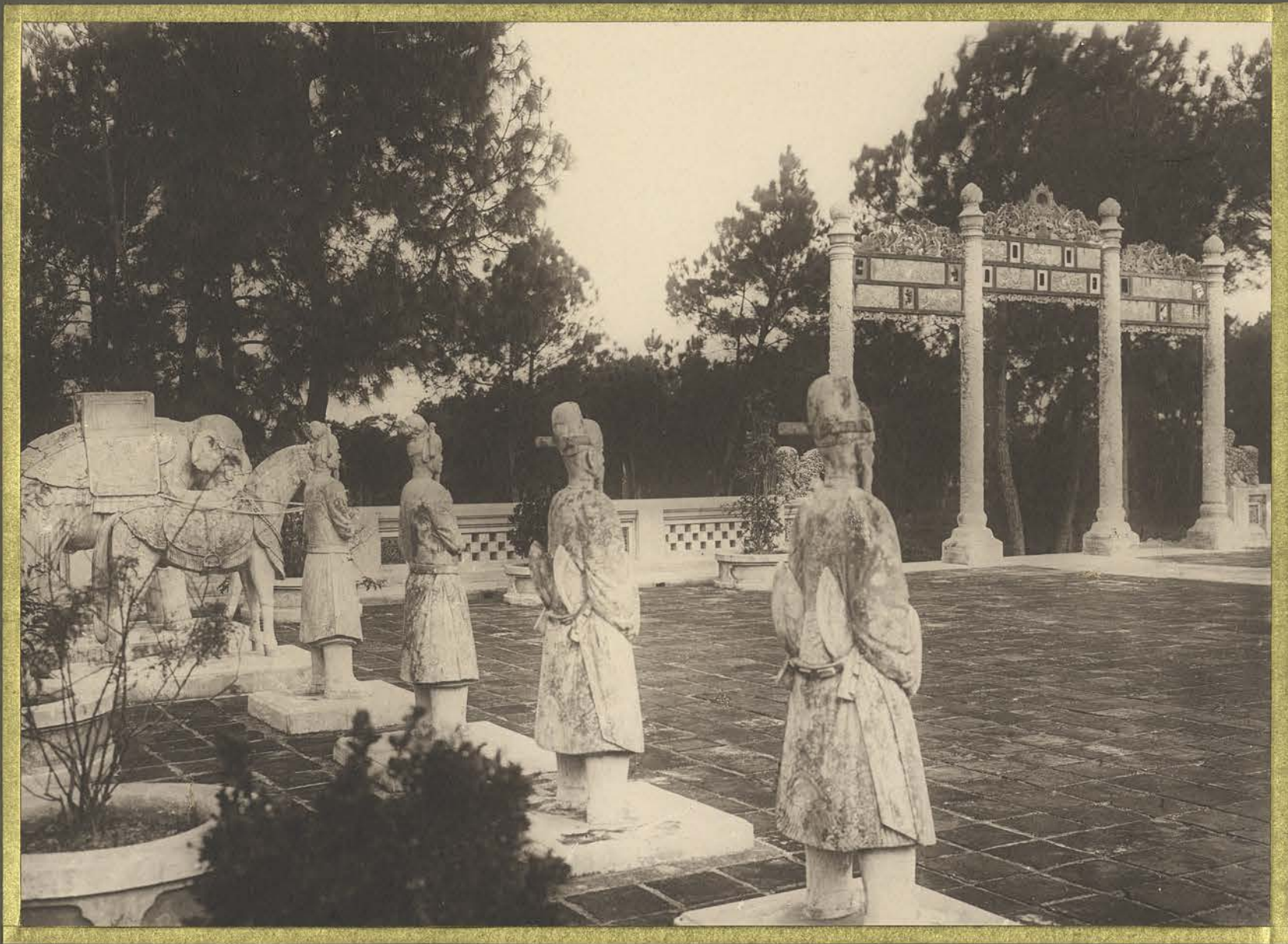
Huè. Tombeau de l'Empereur Đông Khánh. La garde d'honneur.

CENTRE DE DOCUMENTATION ET DE RECHERCHES SUR L'ASIE DU SUD-EST ET LE MONDE INDONÉSIEEN BIBLIOTHÈQUE