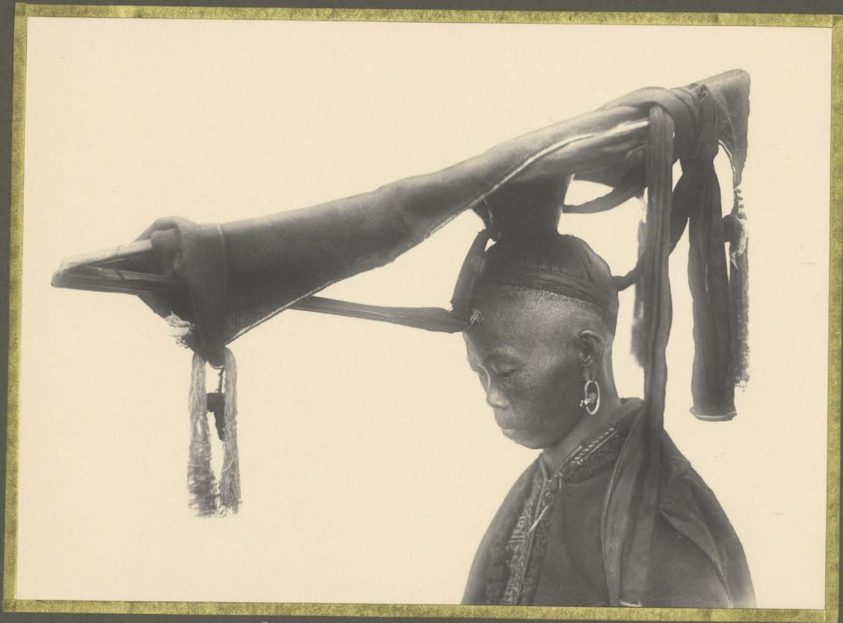
Thong-Cho. Femme Yao-Sin-Tan. Coiffure de mariée.

CENTRE DE DOCUMENTATION ET DE RECHERCHES SUR L'ASIE DU SUD-EST ET LE MONDE INDONESIEN BIBLIOTHEQUE