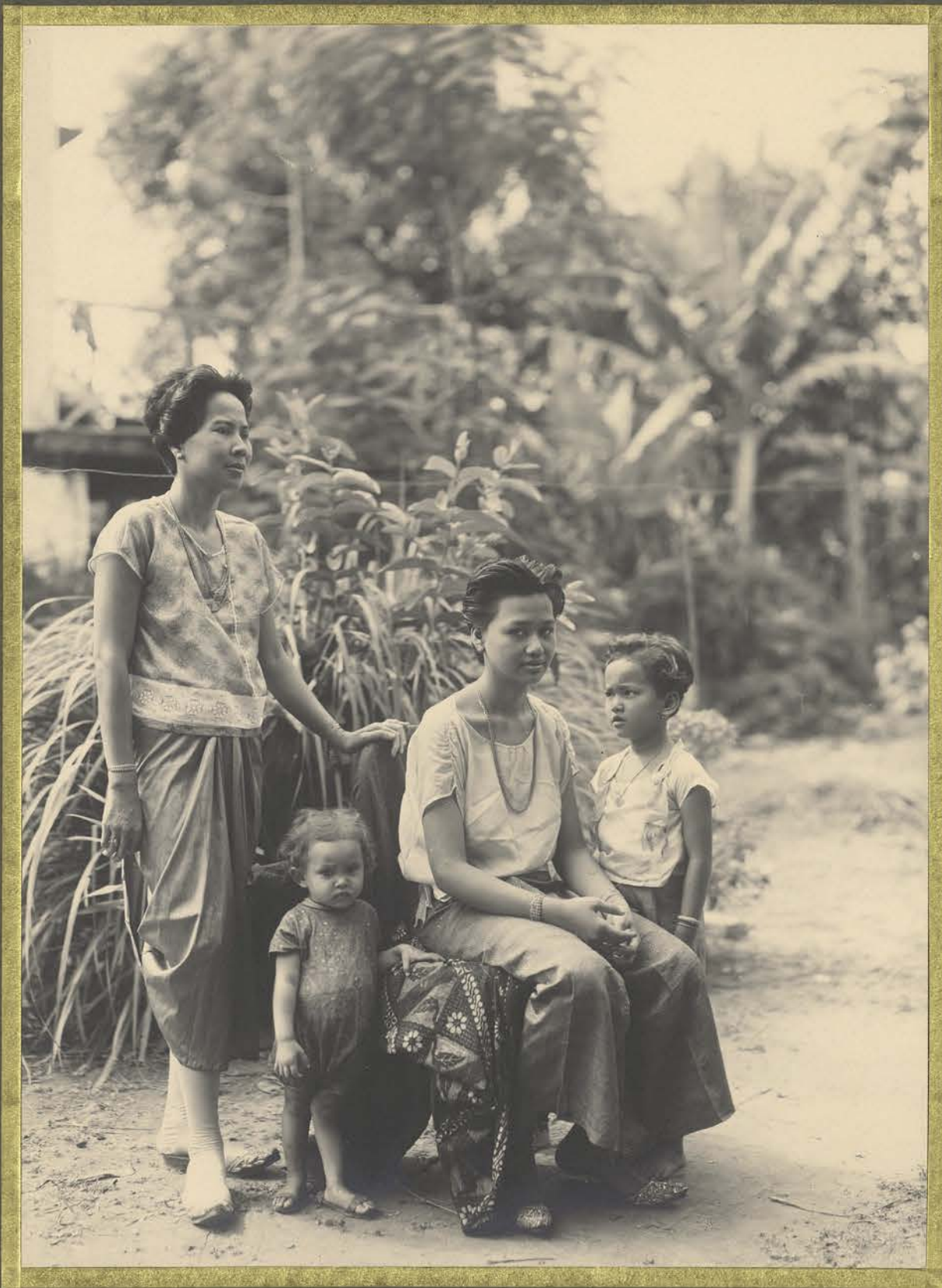
Phnom Penh. Femmes et fillettes Cambodgiennes!