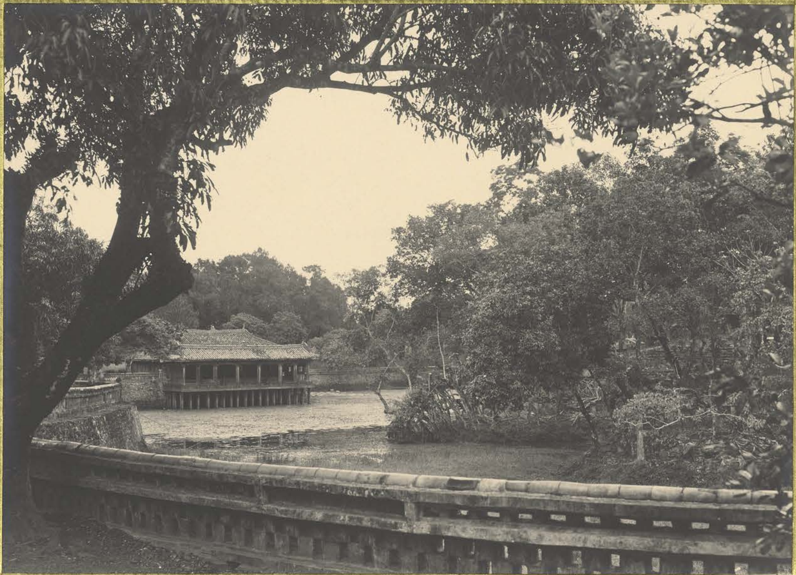
Huê. Tombeau de l'Empereur Minh-Manh. T. D. D. C. Les bains royaux.