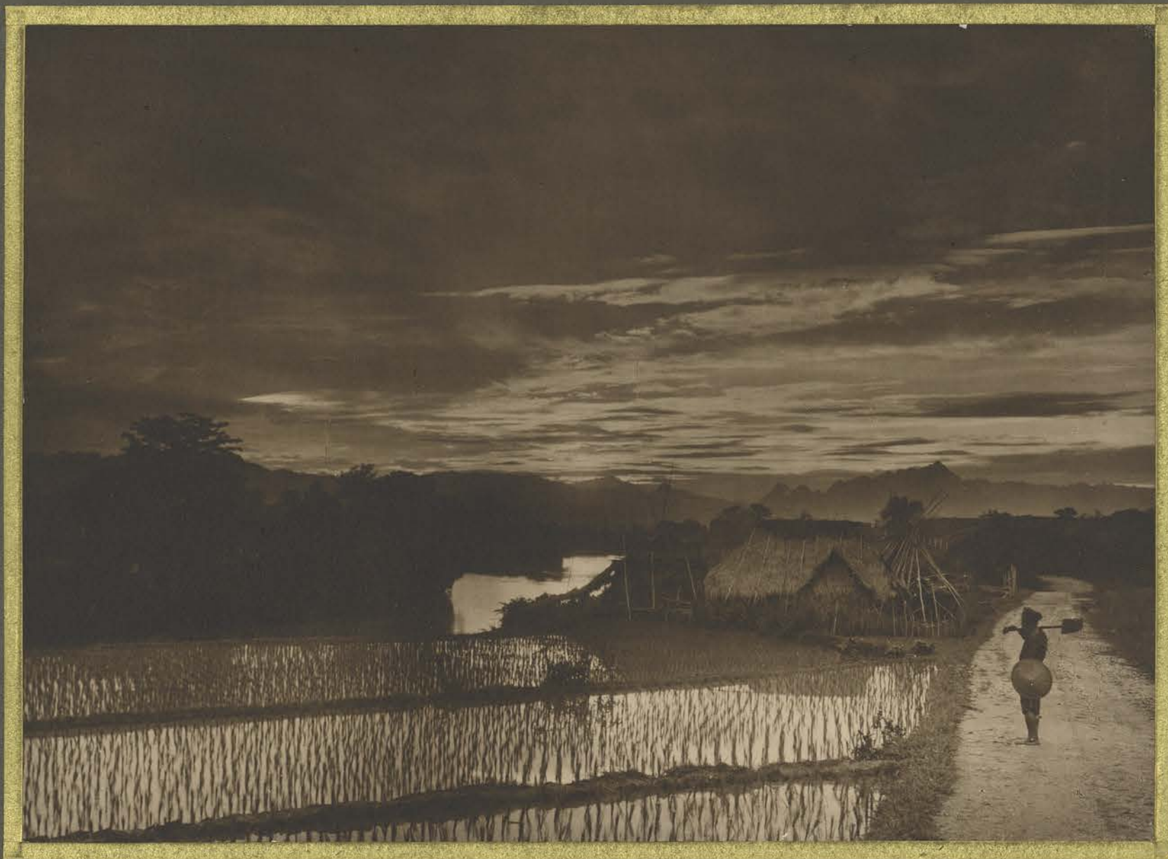
Cao-Binh . Coucher de soleil sur le sông Goc-Lao .

CENTRE DE DOCUMENTATION ET DE RECHERCHES SUR L'ASIE DU SUD-EST ET LE MONDE INDONESIEN BIBLIOTHEQUE