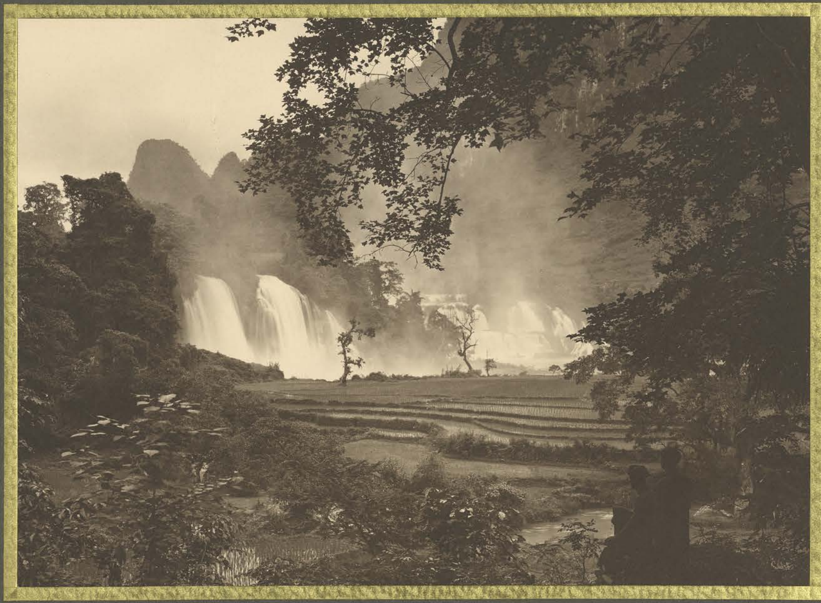
Cao-Bang. Chutes de Ban-Giéc.