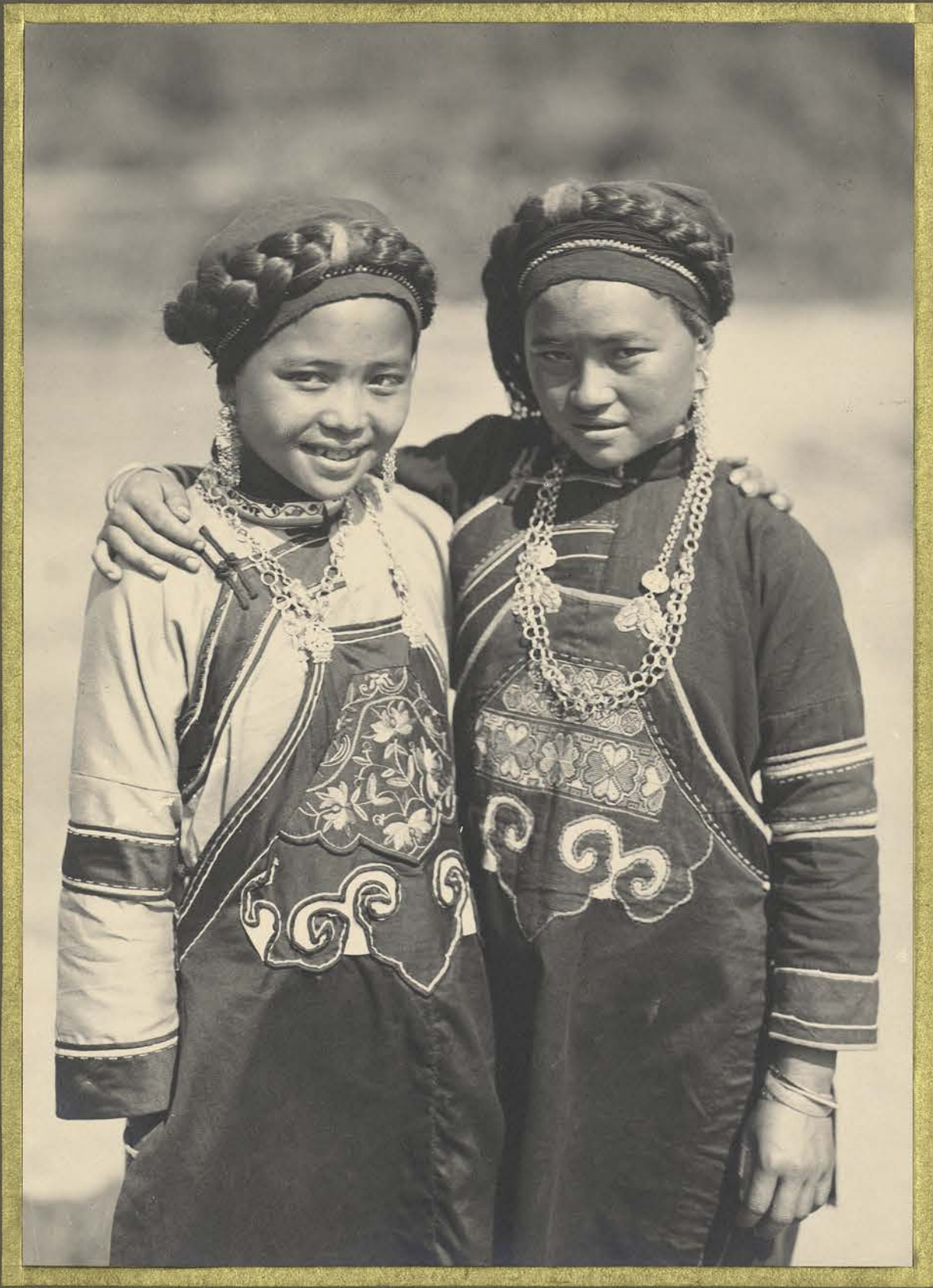
Takha - Filles Pou-La.

CENTRE DE DOCUMENTATION ET DE RECHERCHES SUR L'ASIE DU SUD-EST ET LE MONDE INDONESIEN BIBLIOTHÈQUE