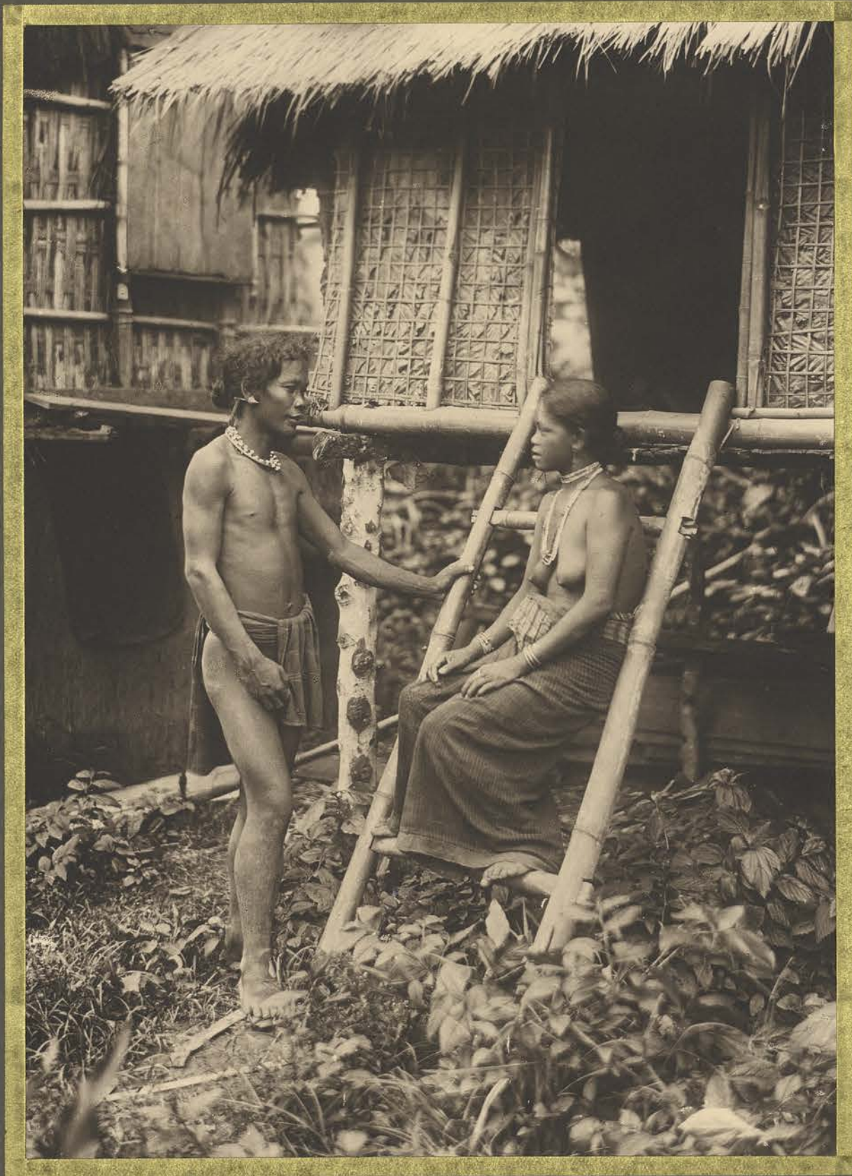
Taksoé, Homme et femme Iha.

ET DE DOCUMENTATION CENTRE DE DOCUMENTATION ET DE SUR L'ASIE DU SUD-EST RECHERCHES SUR L'ASIE DU SUD-EST ET LE MONDE INDONESIEN BIBLIOTHEQUE