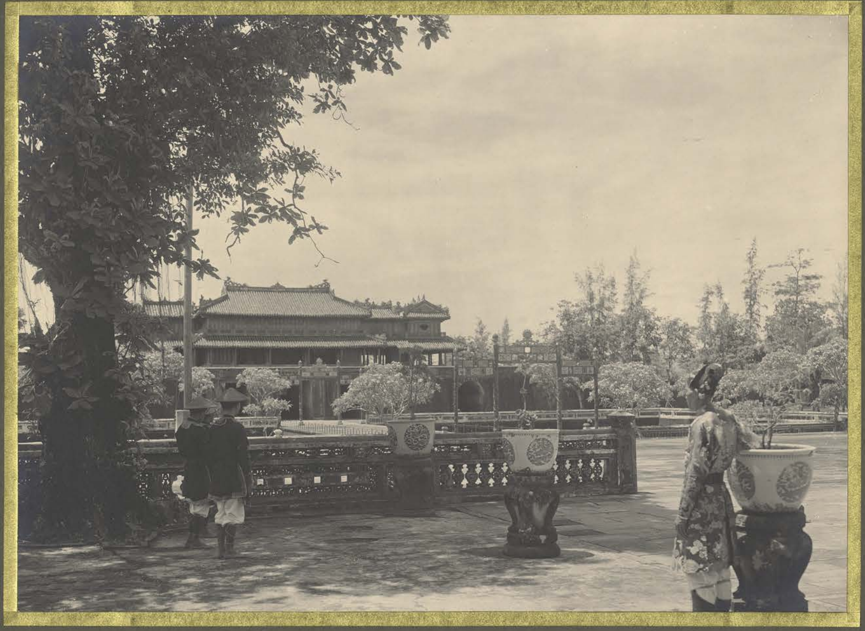
Huế . Vue du Palais Chai-Hoa vers la Porte Ngo-Môn .