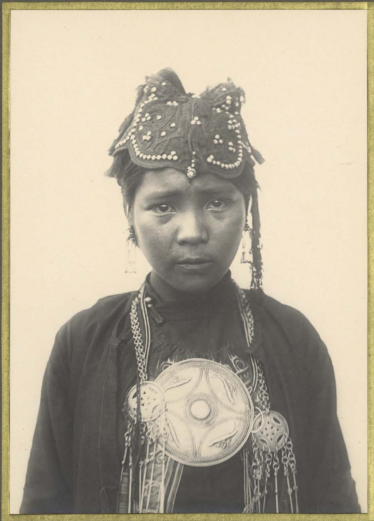
Laos-Hay. Femme Ou-Ni.

CENTRE DE DOCUMENTATION ET DE RECHERCHES SUR L'ASIE DU SUD-EST ET LE MONDE INDONESIEN BIBLIOTHEQUE