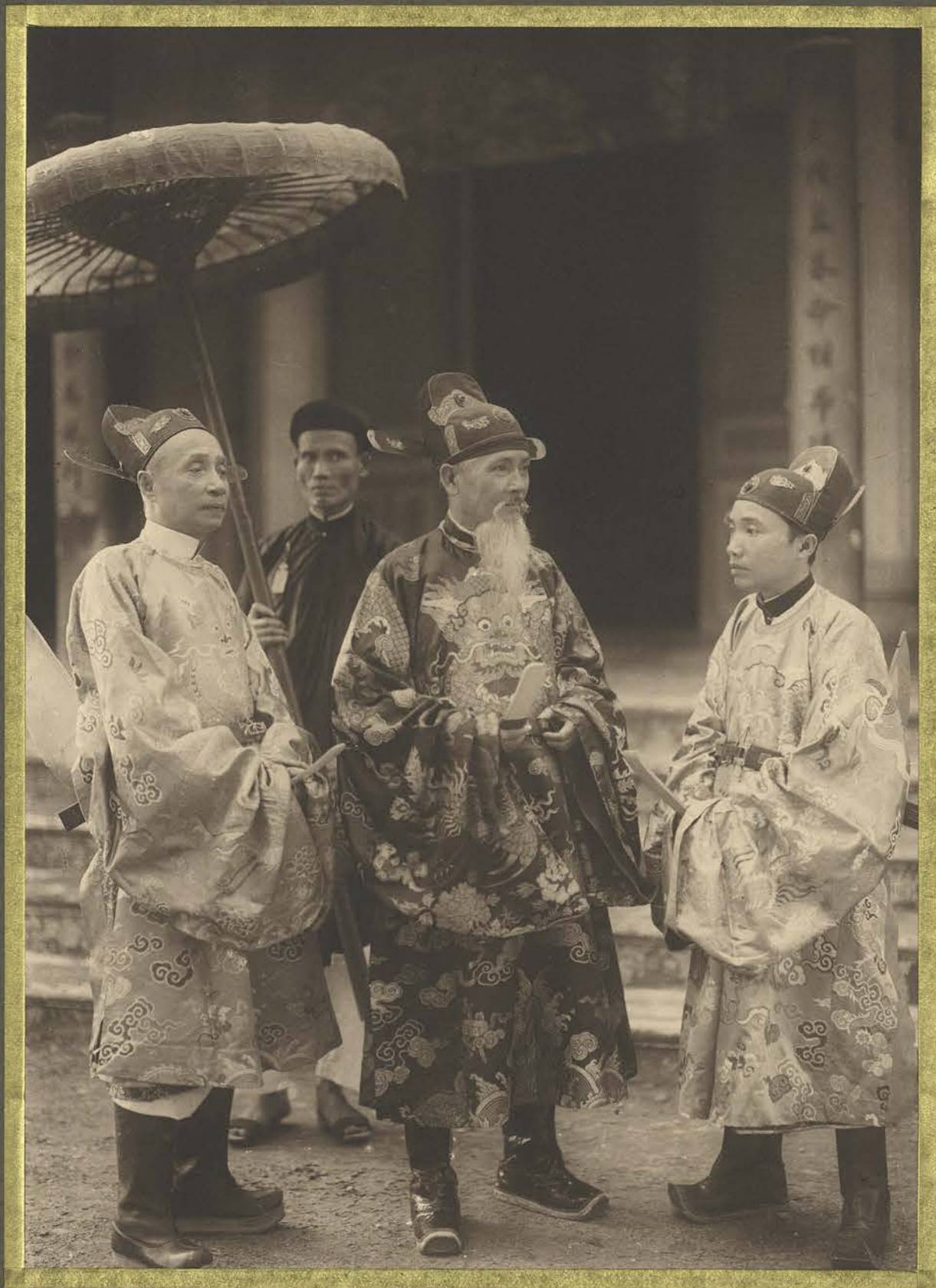
Huê. Les mandarins de la Cour d'Annam.

CENTRE DE DOCUMENTATION ET DE RECHERCHES SUR L'ASIE DU SUD-EST ET LE MONDE INDONESIEN BIBLIOTHEQUE