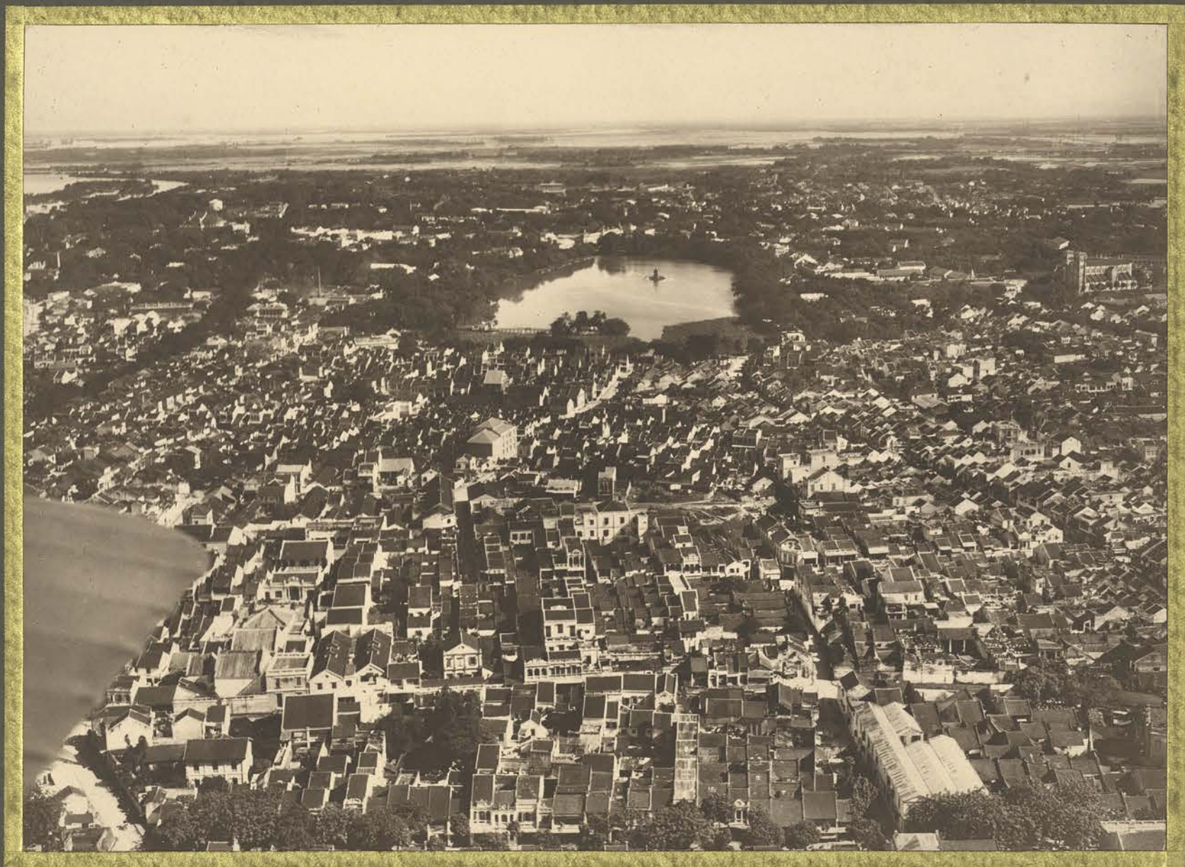
Hanoi. Vue générale.

CENTRE DE DOCUMENTATION ET DE RECHERCHES SUR L'ASIE DU SUD-EST ET LE MONDE INDONESIEN BIBLIOTHÈQUE