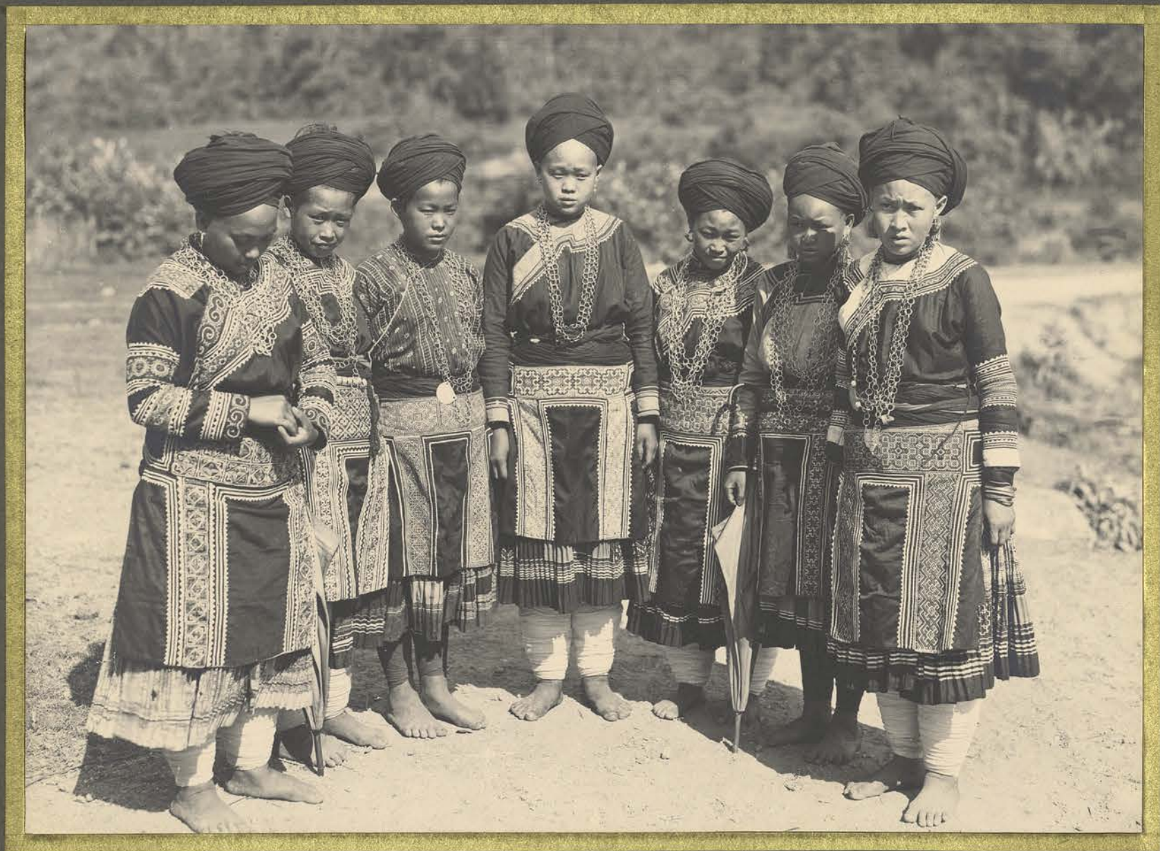
Talahe. Femmes Mboe à fleurs.

CENTRE DE DOCUMENTATION ET DE RECHERCHES SUR L'ASIE DU SUD-EST ET LE MONDE INDONESIEN BIBLIOTHÈQUE