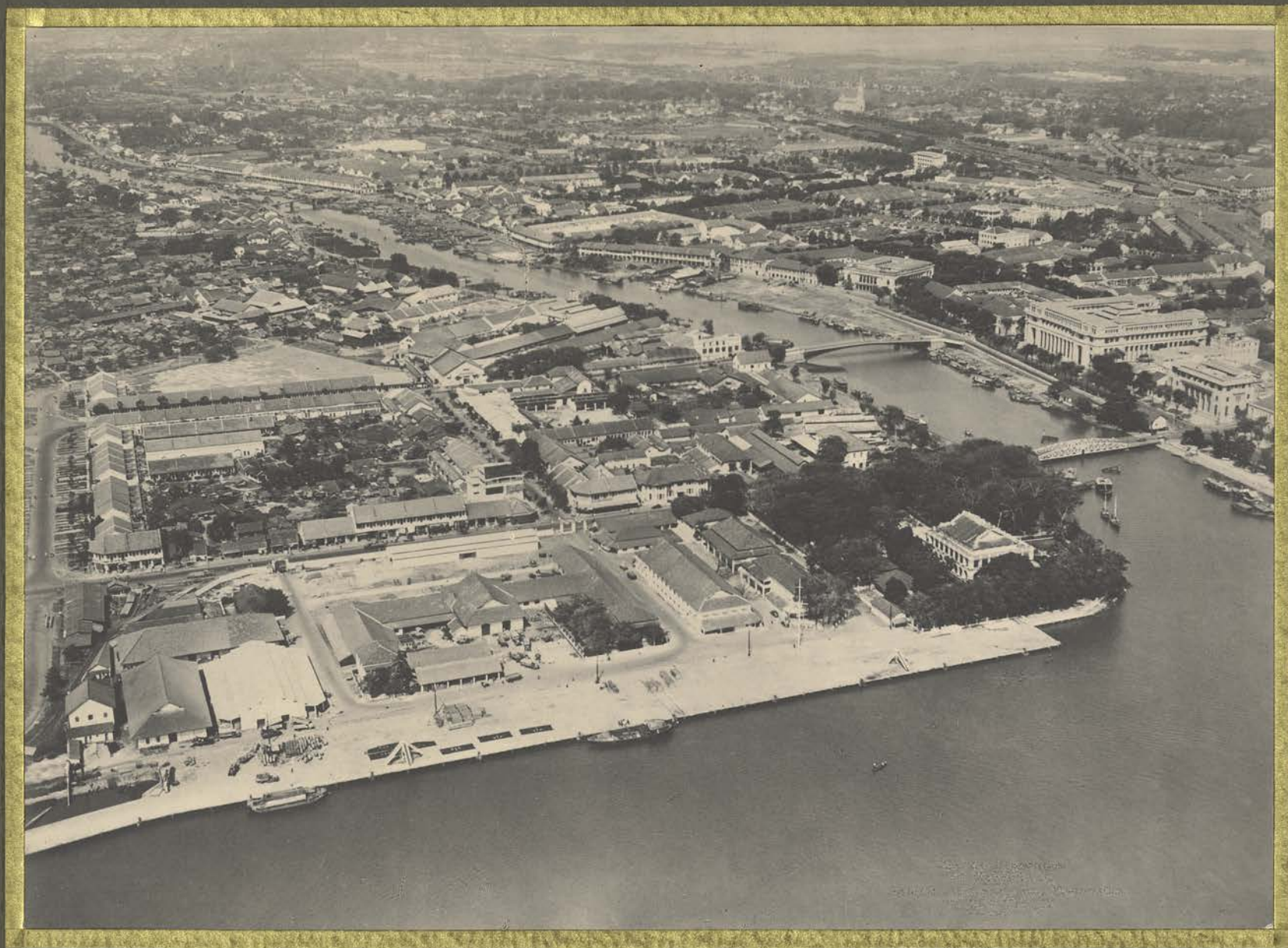
Saigon. Vue générale.