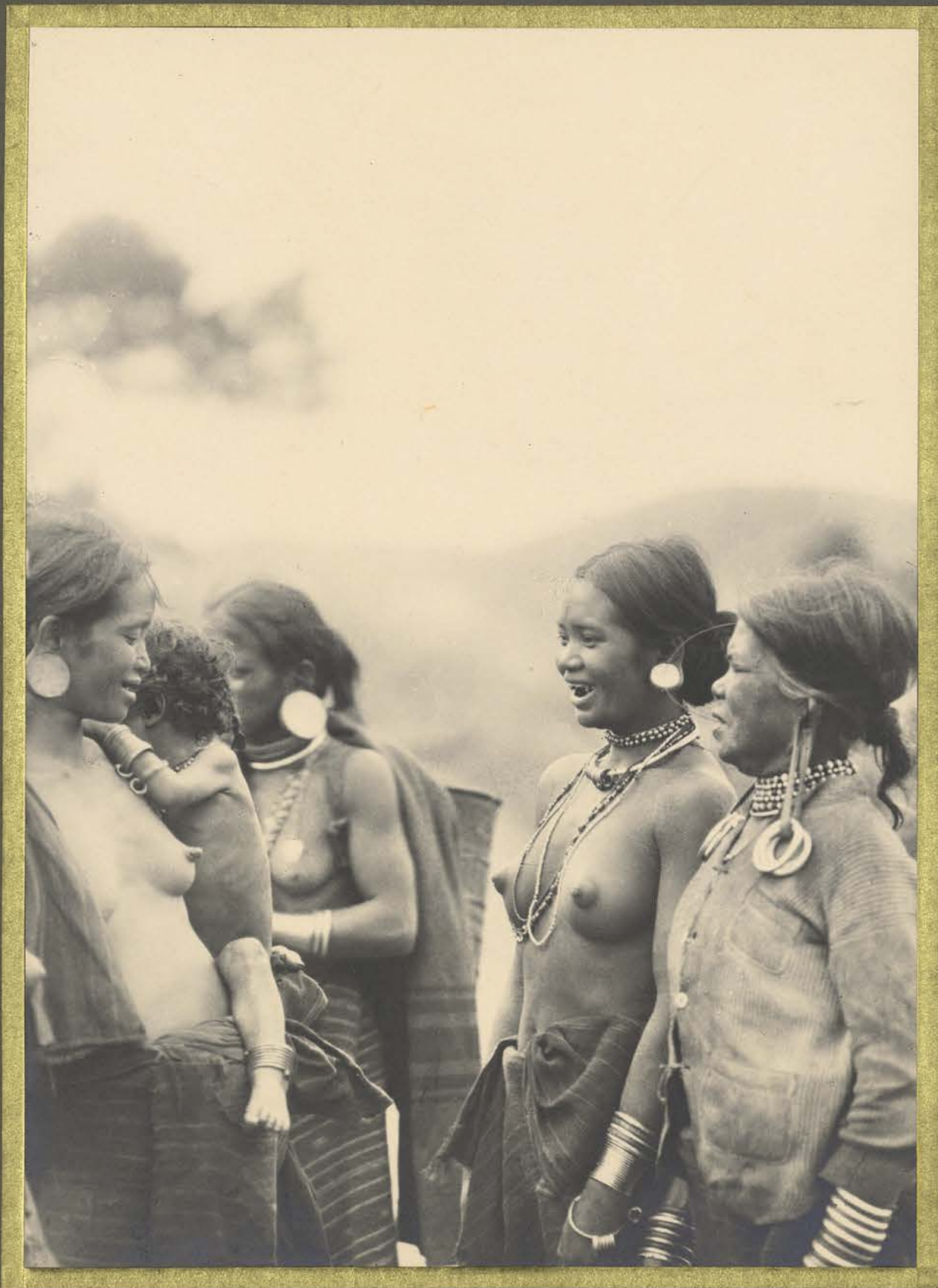
Dalat. Femmes Moïs

CENTRE DE DOCUMENTATION ET DE RECHERCHES SUR L'ASIE DU SUD-EST ET LE MONDE INDONESIEN BIBLIOTHÈQUE