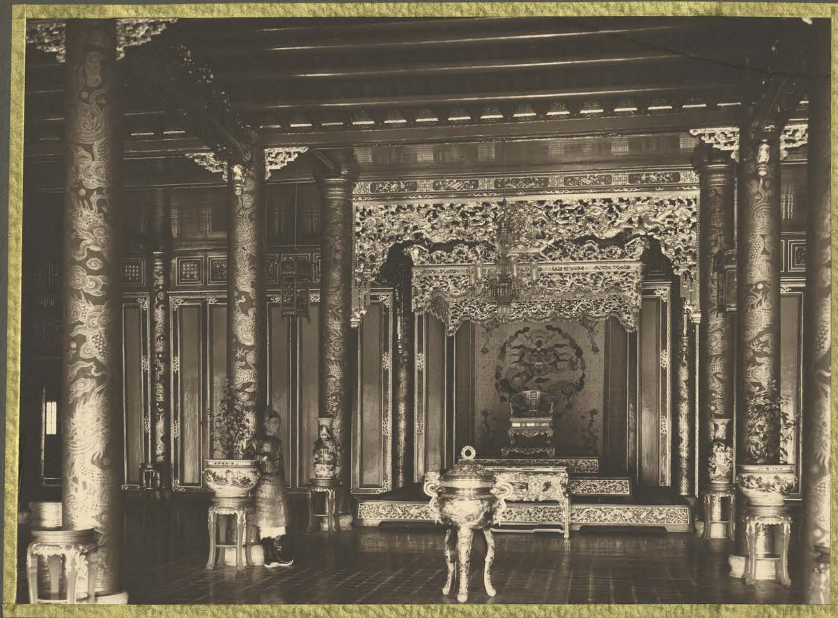
Huế. Le Palais Châi-Hòa. La salle du Trône.