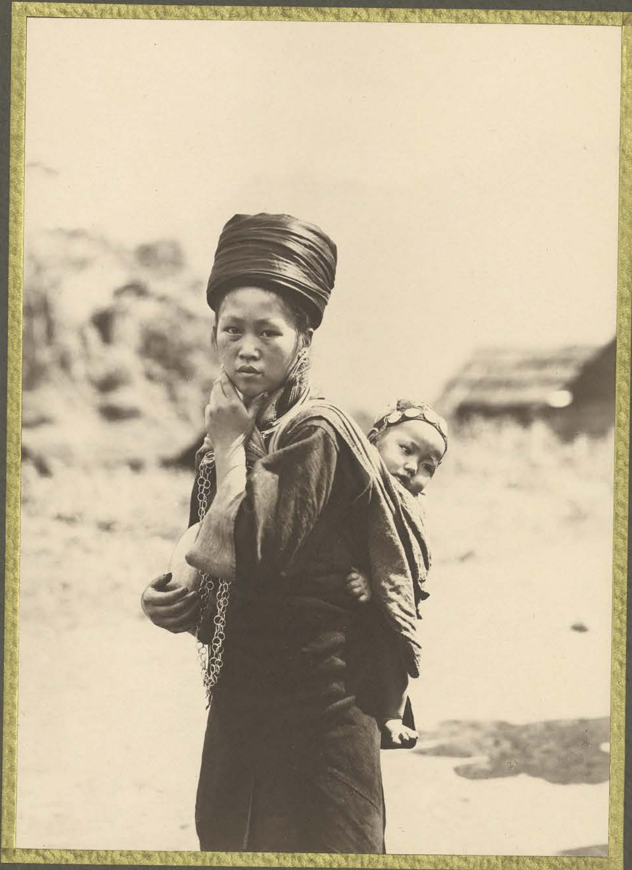
Chapa. Femme Mès et son enfant.

CENTRE DE DOCUMENTATION ET DE RECHERCHES SUR L'ASIE DU SUD-EST ET LE MONDE INDONESIEN BIBLIOTHÈQUE