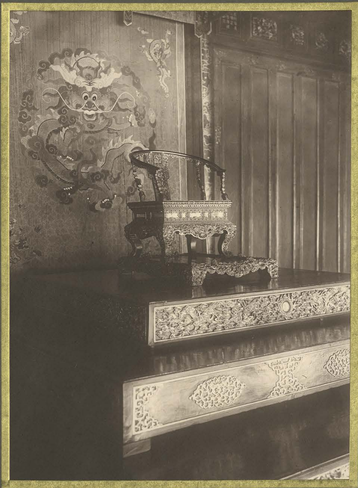
Huế. Le Trône Royal.

CENTRE DE DOCUMENTATION ET DE RECHERCHES SUR L'ASIE DU SUD-EST ET LE MONDE INDONESIEN BIBLIOTHÈQUE