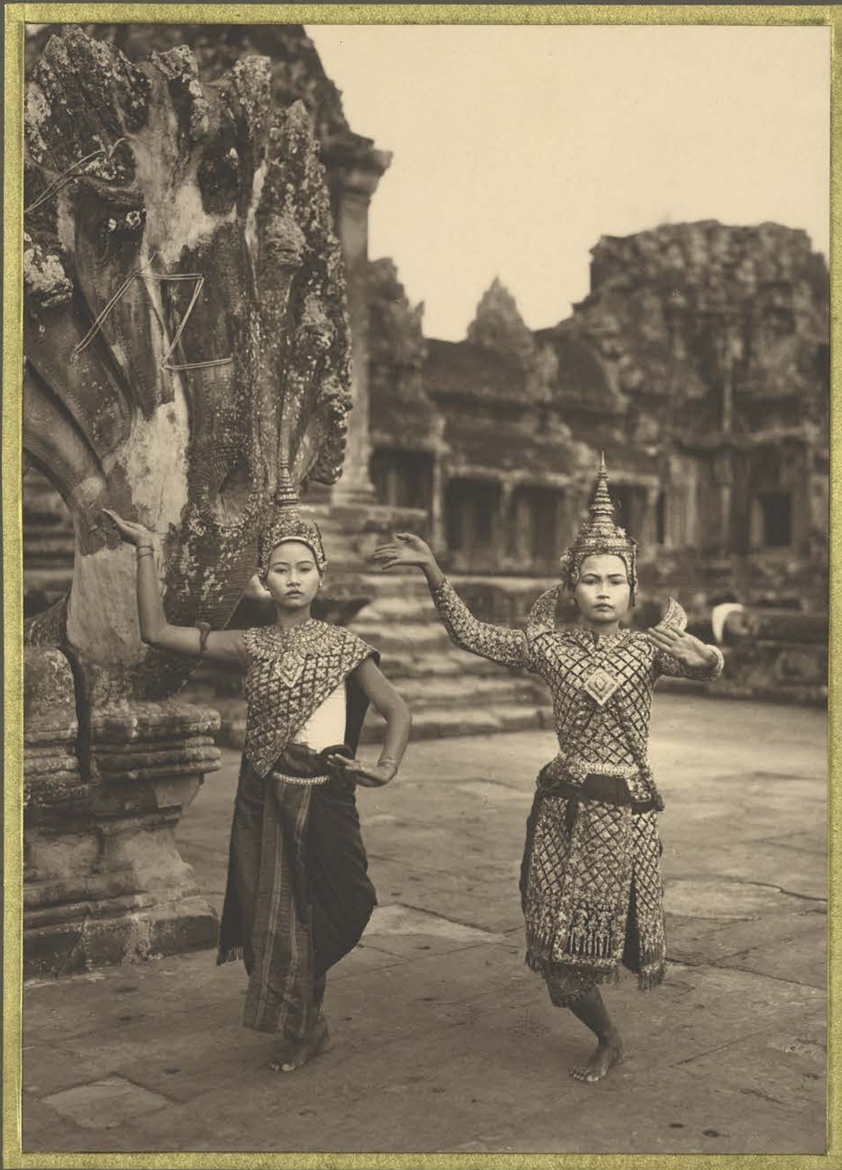
Angkor. Danses Cambodgiennes.