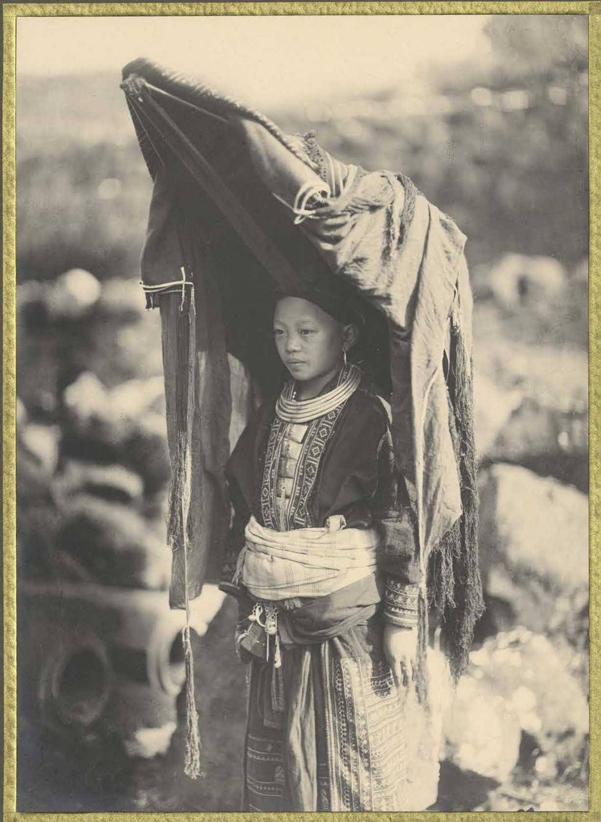
Lao-Hay. Femme Mên en costume de mariale.

CENTRE DE DOCUMENTATION ET DE RECHERCHES SUR L'ASIE DU SUD-EST ET LE MONDE INDONESIEN BIBLIOTHÈQUE