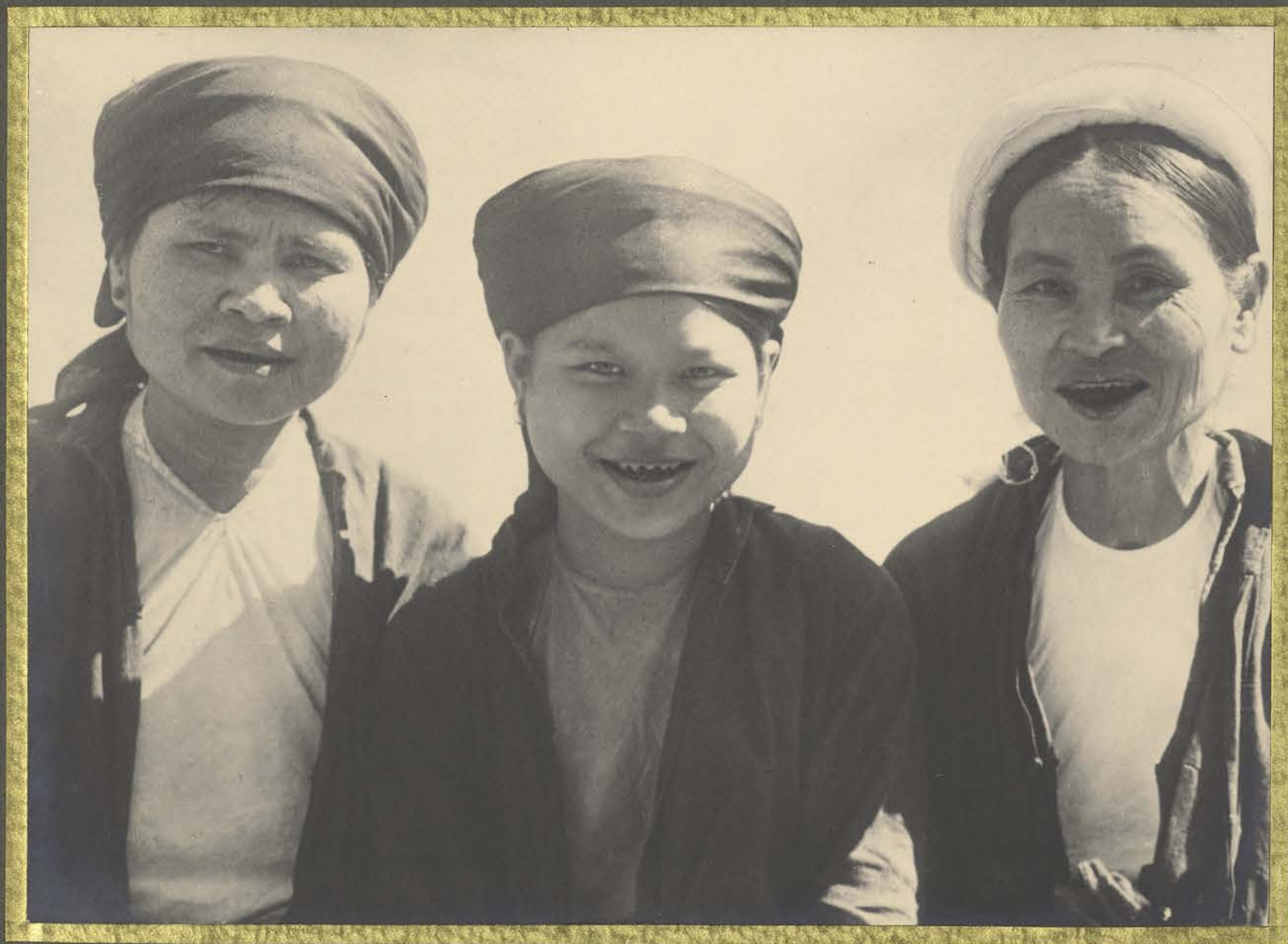
Hadong. Taypames Sonkinoises.

CENTRE DE DOCUMENTATION ET DE RECHERCHES SUR L'ASIE DU SUD-EST ET LE MONDE INDONESIEN BIBLIOTHEQUE