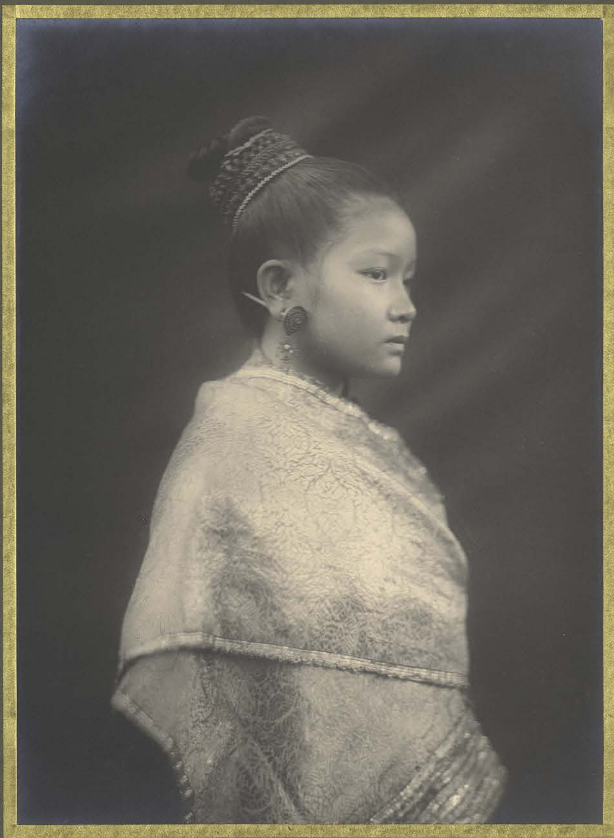
Luang-Prabang. Fille Laotienne.

CENTRE DE DOCUMENTATION ET DE RECHERCHES SUR L'ASIE DU SUD-EST ET LE MONDE INDONESIEN BIBLIOTHÈQUE