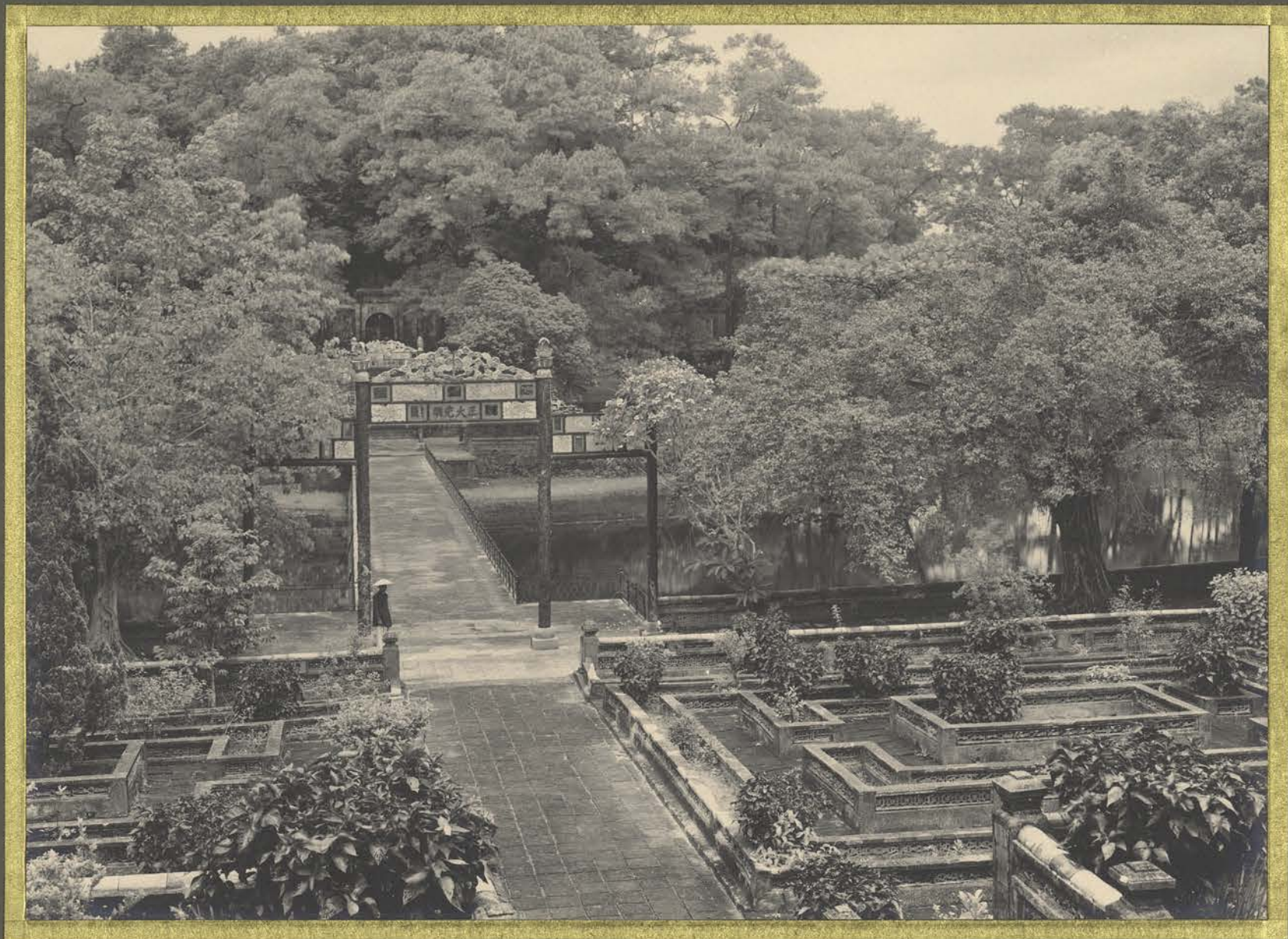
Tombeau de l'Empereur Minh Mang. Au fond: le tombeau.