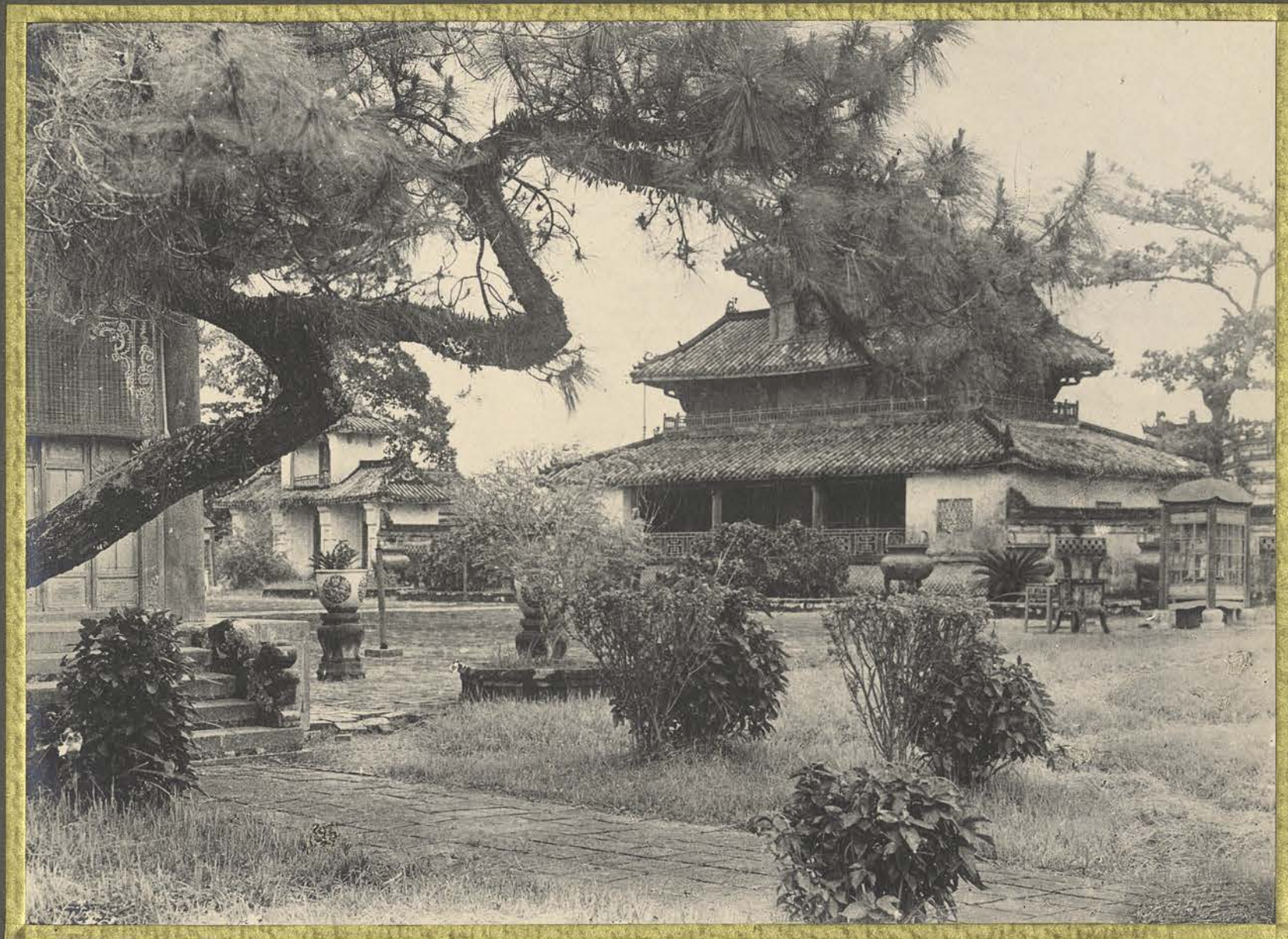
Huê. La cour du temple des urnes dynastiques.