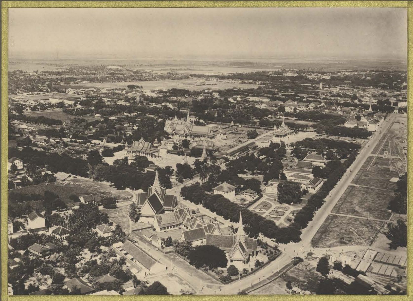
Phnom-Penh. Le Palais Royal.

CENTRE DE DOCUMENTATION ET DE RECHERCHES SUR L'ASIE DU SUD-EST ET LE MONDE INDONESIEN BIBLIOTHÈQUE