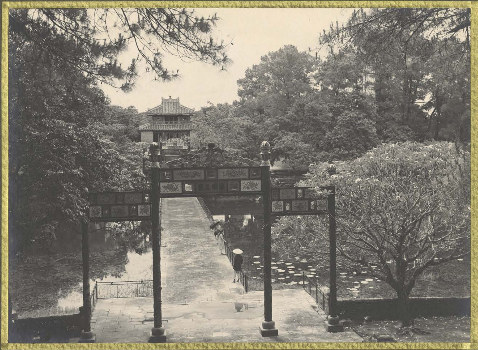
Huï. Tombeau de l'Empereur Minh-Manh. Un portique.

CENTRE DE DOCUMENTATION ET DE RECHERCHES SUR L'ASIE DU SUD-EST ET LE MONDE INDONESIEN BIBLIOTHEQUE