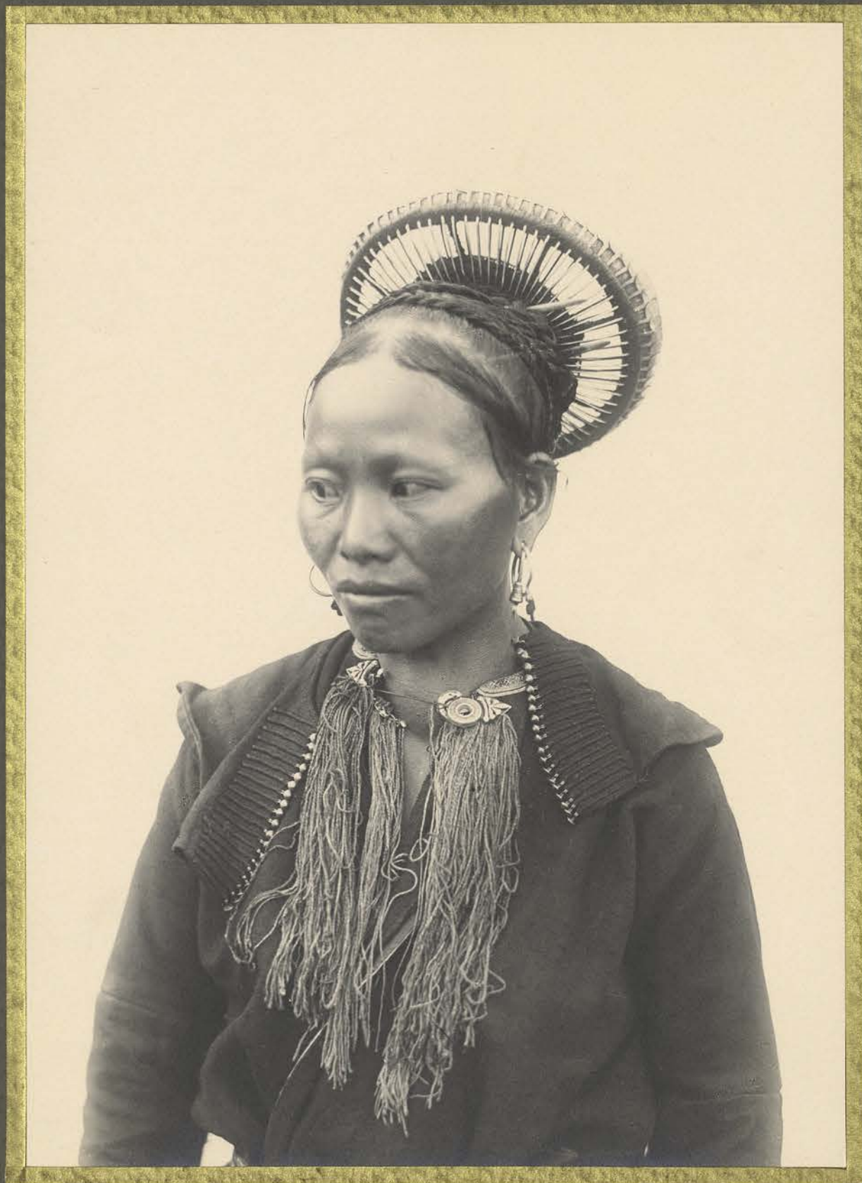
Chong-Chô. Femme Shinc-Cao-Yao.

CENTRE DE DOCUMENTATION ET DE RECHERCHES SUR L'ASIE DU SUD-EST ET LE MONDE INDONESIEN BIBLIOTHÈQUE