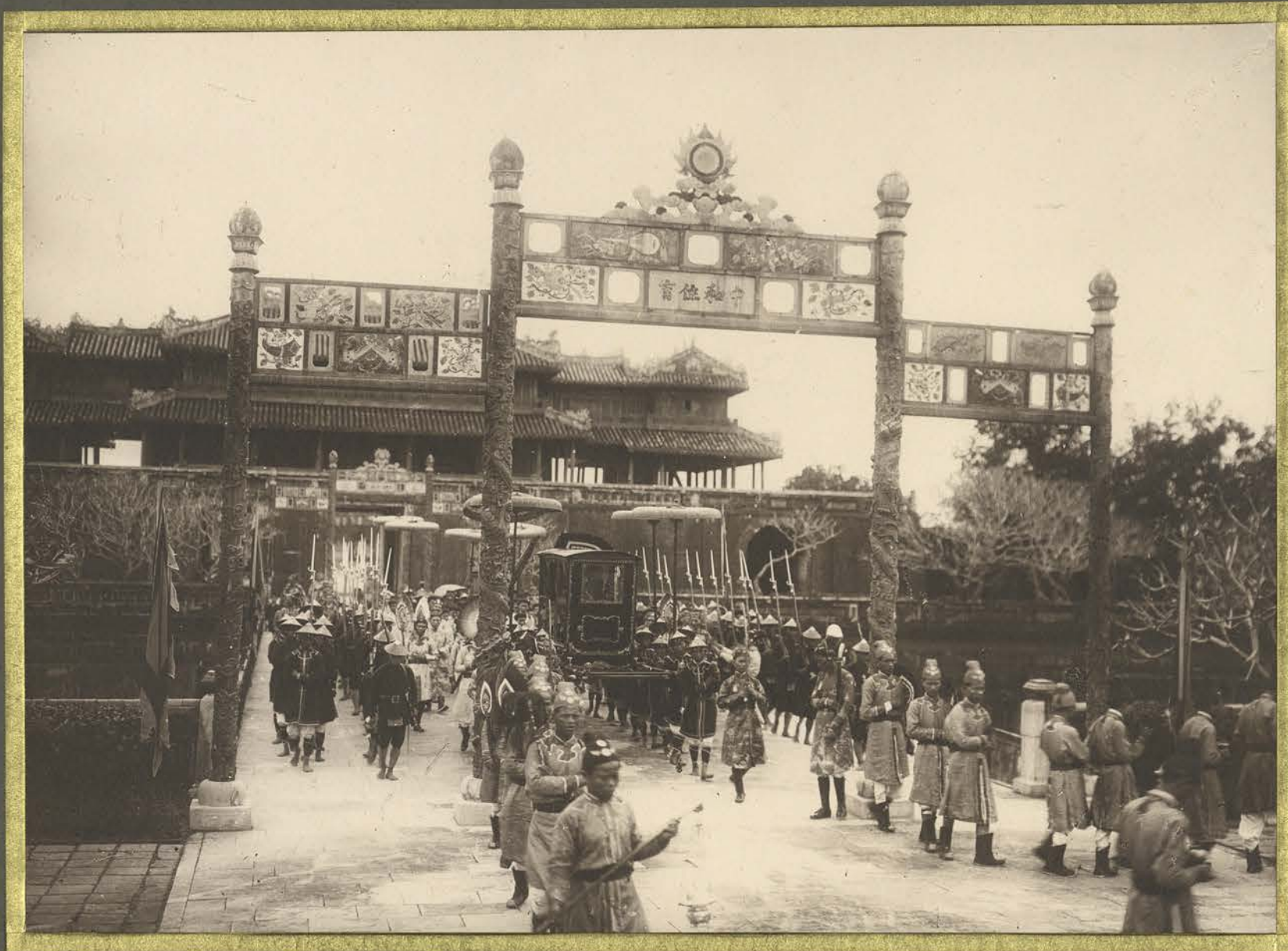
Huë. Le cortège royal.